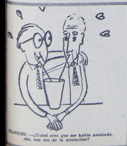
FRONDIZI: —¿Usted cree que me había asustado, che, con eso de la anulación?