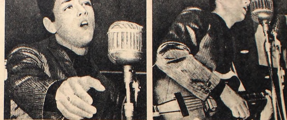
La radio hace mucho que dejó de ser un órgano de promoción de la cultura popular. Este jovenito no importa su nombre— es uno de esos tíos de la juventud acostumbrados a dopar a la gente. Y con el peor gusto que se pueda imaginar.