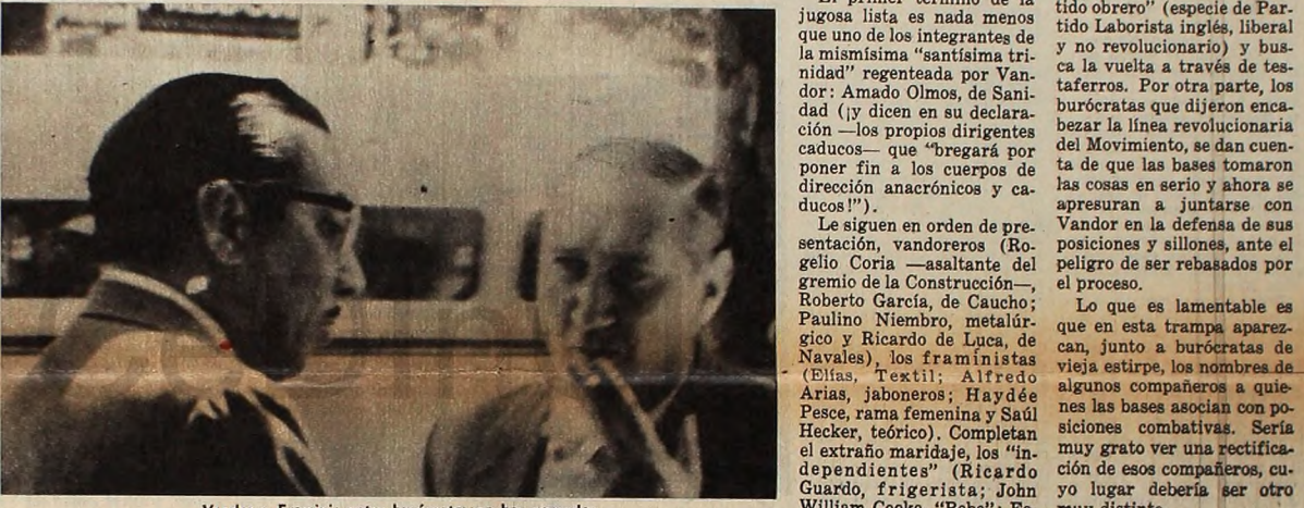
Vandor y Framini: entre burocratas no hay conadas.

El general Alsogaray ha confesado su impotencia para capturar a los guerrilleros de Salta, lo cual trasforma el burgués equilibrio del gordo dirigente del Partido Comunista que, siempre animoso en su tarea de ampliar la "brecha democrática", ha corrido a declarar al Ministerio del Interior que "existen o no existen los guerrilleros, una cosa es cierta: no son comunistas". Una vez más, como en el 45 y el 55, Codovilla se ubica en el papel de furgón de cola de la oligarquía, manteniendo a su partido al margen de las masas populares. En su actividad, refleja su entrañable amor al régimen, en el que se las arregla para encontrar "matices democráticos" a pesar de que fue producto del fraude y de la proscripción de las mayorías populares, y su odio a todo lo que pueda poner a la revolución, desprecia a los traidores, a los hombres que saben jurarse la vida por la causa del pueblo. Del mismo modo, no le cuesta nada cumplir el papel de policía, declarando delincuentes comunes a los militantes del MNR Tacuara, detenidos por sus acciones políticas. Adopta así la misma actitud que la Guardia Restauradora Nacionalista y la reacción de Tacuara, haciendo méritos, junto con ellos, ante el régimen. En su hora, la justicia popular sabrá cobrar cuentas.