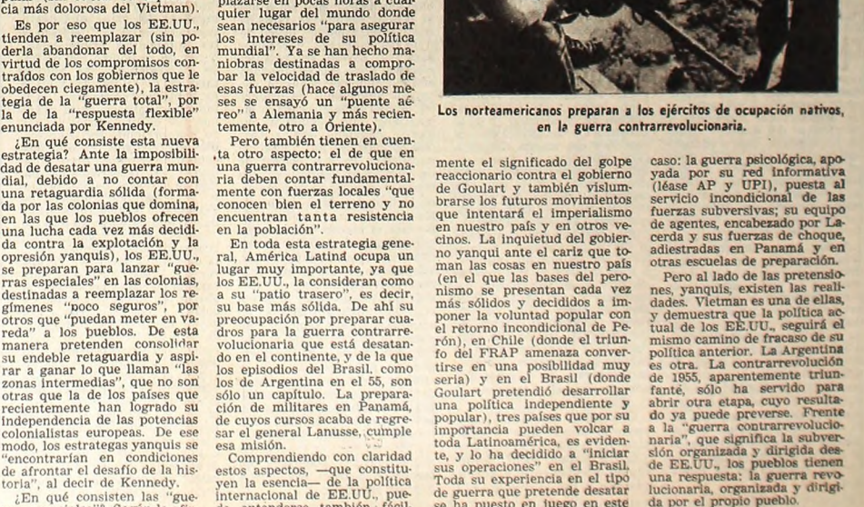
Los norteamericanos preparan a los ejércitos de ocupación nativos, en la guerra contrarrevolucionaria.