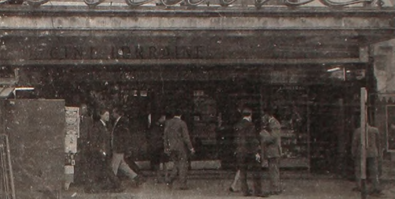
Los críticos de la calle Corrientes suelen reunirse en algunos de los cafés del centro para cultivar su angustia de bolsillo y su esterilidad empañada en negar a la realidad y vivir vegetando de espaldas al país y aún a sí mismos. Este es el cine Lorraine, habitual centro de reunión de nuestros "mandarines".

dirigiéndose a distintos públicos, influyen negativamente sobre ellos. Mal que les pese a los cineclubistas, a los snobs, a los "izquierdistas", la cercanía de Radiolandia o de Antena no sólo se da en los quioscos de revistas de la calle Corrientes. A usted, lector, que nos está leyendo, le pedimos ahora que lea sin temer, este tipo de publicaciones. Usted es portador de una ideología revolucionaria, no pequeño burguesa, Así que está inmunizado y no corre el riesgo de contaminarse. (La brevedad del espacio nos hace esquemáticos, sin quererlo, pero le prometemos una próxima nota en la cual trataremos de explicarle en la medida de nuestras posibilidades que entendemos por una auténtica CRITICA DEL CINE.)