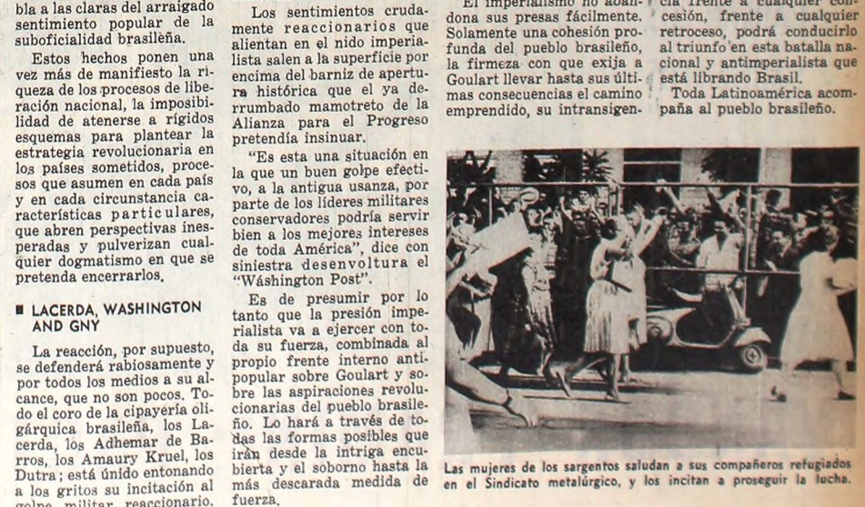
Las mujeres de los sargentos saludan a sus compañeros refugiados en el Sindicato metalúrgico, y los incitan a proseguir la lucha.

■ LOS SARGENTOS JUNTO AL PUEBLO La crisis brasileña se ha reflejado en la estructura de las propias fuerzas armadas. Es en la suboficialidad donde ha prendido con inusitada profundidad el sentimiento ant imperialista apocoyado de las masas brasileñas. Los precedentes de esta situación no faltan, ciertamente, y la vibrante "Carta al Sargento Prestes de Paula" que COMPANERO publicara recientemente, esa encendida proclama a la rebelión contra el régimen, habla a las claras del arraigado sentimiento popular de la suboficialidad brasileña. Estos hechos ponen una vez más de manifiesto la riqueza de los procesos de liberación nacional, la imposibilidad de atenerse a rígidos esquemas para plantear la estrategia revolucionaria en los países sometidos, procesos que asumen en cada país y en cada circunstancia características particulares, que abren perspectivas inesperadas y porvenir que se pretenda encerrarlos. ■ LACERDA, WASHINGTON AND GNY La reacción, por supuesto, se defende rabiosamente y por todos los medios a su alcance, que no son pocos. Todo el coro de la cipayería oligárquica brasileña, los Lacerda, los Adhemar de Barros, los Amaury Krueh, los Dutra; está unido entonando a los gritos su incitación al golpe militar reaccionario.