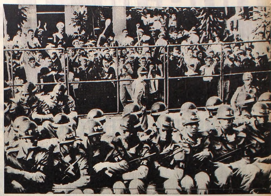
Los sargentos en el Sindicato Metalúrgico: símbolo de una unidad que ya está en proceso de soldarse en la lucha contra los reaccionarios.