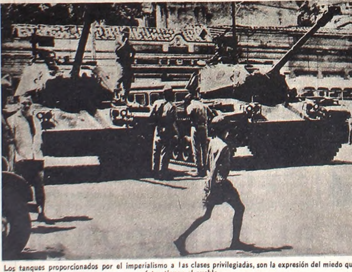
Los tanques proporcionados por el imperialismo a las clases privilegiadas, son la expresión del miedo que éstas tienen al pueblo.

El episodio es más que una simple anécdota. Está encerrando, quizás todo el sentido de esa marea popular que hoy, de un confin a otro del Brasil, está al borde de sacudir el país hasta sus mismos cimientos. ■ LUCHA SOCIAL, REVOLUCION Es posible distinguir un cara y cruz en las fuerzas populares brasileñas: por un lado la lucha social ha alcanzado en el país vecino características de verdadera violencia. La clase obrera, cas-