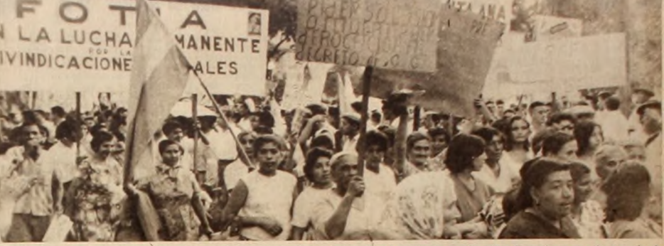
La FOTIA y los trabajadores azucareros no se dejarán confundir por la reacción. La reciente marcha sobre Tucumán es una clara prueba de la combatividad y la decisión que anima a los cañeros.

los cañeros del Norte—en realidad, cuatro o cinco negros propietarios de grandes latifundios, donde se explota inicuamente a cientos de compatriotas y a un número mayor de braceros bolivianos—pidieron separar de la paritaria nacional a los trabajadores del surco, con la manifiesta intención de dividir al sector obrero y llevar a la gente del campo al estatuto del peón. La enérgica y rotunda oposición obrera expresada a través de todos los representantes del Frente Unico Nacional de Trabajadores Azucareros y la positiva posición de la Unión de Cañeros Independientes de Tucumán, parecieron haber concurrido definitivamente la maniobra. Decimos "pareciera", por cuanto sabemos que está en la intención del Director Nacional de Delegaciones Regionales, primero, tratar de reducir al mínimo la representación obrera, y luego, limitar la paritaria solamente a la discusión de las remuneraciones