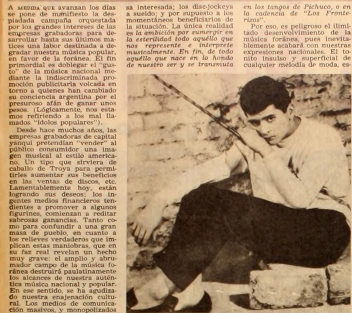
Palito Ortega, actual ídolo de una fábrica que los crea y los destruye con despiadada rapidez para adormecer los auténticos valores nacionales. Mientras sirva para hacer dinero, caminará. Después, los grupos imperialistas que controlan el gran negociado del disco, se desprendrán de él.