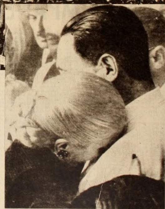
Esta foto es histórica. Es el testimonio del 17 de octubre de 1951, el último en que los Descamisados pudieron festejar junto a Evita. Ella acaba de recibir la Medalla de la Lealtad de manos del Líder, y llora sobre su hombro.

Las filas inacabables formadas por el pueblo después del 26 de julio. Todos querían rendir el último homenaje a Evita. El amor para quien fue auténtica bandera de lucha revolucionaria quedó plenamente testimoniado por el pueblo.