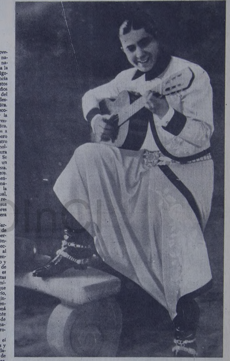
Cierto día le alcanzaron a Gardel un tango para que lo cantara. En él se pintaba al suburbio como una madriguera de malandras. ¡"Peró, che! —exclamó el Zorzal indignado—. ¿Estos qué se creen? Ni que fuésemos dos delincuentes. ¡Este tango es puro grupo! Yo sí conozco el arrabal, y allí no hay vida pa' chorros. Además, che, si allí vive algún malandrar, hay también 20.000 laburantes que se levantan a las 5 de la mañana... ¡Que se dejen de macanear! ¡Yo no canto eso!... ASI ERA CARLITOS GARDEL.

GARDEL: HOMBRE De pibe, nomás, había demostrado sus especiales cualidades que más tarde le darían resonancia popular. Hizo de todo en la cotidiana lucha por la supervivencia. Pero enlazó su ruta por los turbulentos aleados del Mercado de Abasto. Allí, en el centro mismo de la "ranada", del vigoroso y distintivo malevaje porteño, impuso su nombre: lo conoceríamos con el mote de "El Morocho del Abasto". Conversaba, interpretaba los tangos, en cada uno de sus fraseos transmitía un sentimiento de indefinible sustancia: invitaba a la confesión, a la comunidad anímica. Ya fuera en Belgrano, Barracas, Corrales o Mataderos, talaba su creciente y justificada fama. Su vida bohemia, apasionada regulada por el sol de las madrugadas, se selló en cualquier barrio, en cualquier café, allí donde le facilitaran una guitarra, y ante asombrados y admirados parroquianos. Tuvo ribetes de suspenso su encuentro con Pepe Razzano. Ambos eran lo mejor que había dado nuestra música, en cuanto a cantores. Ante 30 personas dilerimieron la supremacía. Un gélido ambiente rodeó dicha payada. El oriental entonó "Entre colores de grana". Gardel lo aplaudió. A su turno, interpretó una canción en boga. ¿En resumen? Terminaron cantando a dúo por largos años, respetándose mutuamente en sus valores. Fue por 1911, en La Plata, y por enfermedad de Razzano, aquel famoso dúo se disolvió. Comienza a brillar la estrella de Gardel.