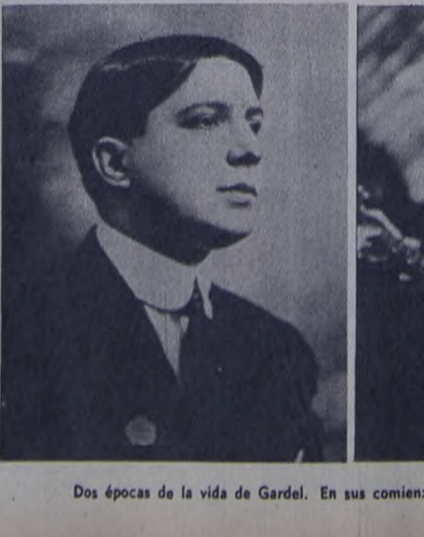
Dos épocas de la vida de Gardel. En sus comienzos y en el apogeo de su carrera.

Gardel tomó los elementos yacentes en las mejores tradiciones culturales argentinas, para darles forma musical. Si el Martín Fierro es la expresión lacrada y doliente del gaucho perseguido por la oligarquía terrateniente, Gardel es el Martín Fierro urbanizado: rebelde en tanto enfrenta a los núcleos "selectos" con sus cantares enraizados en lo nacional; pueblo, pues, transita por las venas de los humildes; resguardando sus costumbres culturales, y contrario a las minorías alienadas del extranjero... "lo que me gusta es el canto popular en un mundo de una nación y de cultura, no es el hecho ar, sino su modo de concepción del mundo y la vida en conjunto con la "sociedad oficial". Gardel creó con el tiempo, resguardando sus costumbres culturales permanentes, un intérprete de las vidas y ambiciones de su pueblo. Es que alza enhiesta la voz y las banderas nacionales en toda cultura hay un punto torrencial y ardiente, hecho por el genio irracional del pueblo y cuyo más alto producto es el arte... [Arregui].