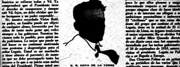
Y. HAYA DE LA TORRE