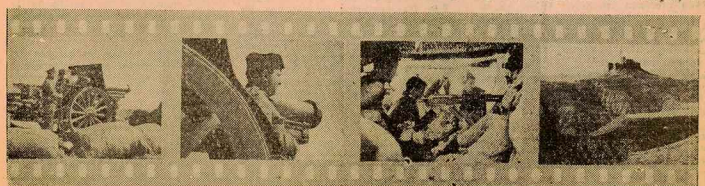
Cuatro aspectos de las luchas de los primeros momentos en los frentes de Aragón

los cuerpos coercitivos que se colocaban en buena parte frente a él. Era el fascismo que, al fin, se decidía a dar el golpe, ante unos poderes vacilantes, vencidos de antemano, sin conciencia del peligro que les acechaba, corrompidos por una etapa de immoralidades y represiones que alejaron de ellos a lo único bueno, puro y vital que sobrevivía: el proletariado. Era llegado el momento de hacer bueno lo que habían constituido promesas sin cuento en millares de mítines y juramentaciones dentro de la intimidad fraterna de las Asambleas generales. El sentimiento trágico de la vida y la conciencia del momento lanzaban fuera de sus talleres, fábricas y obras a los trabajadores que, vigilantes, salían a la calle día y noche dispuestos a ofrendar su vida para impedir la victoria del fascismo. Llegado el momento supremo, a falta de armas oponía al enemigo la muralla de sus cuerpos, el