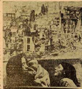
Un aspecto de la obra del fascismo

La libertad — decía Castelar — es una joya, que cuesta muy cara. Exacto! Al pueblo éuscara esta libertad que ahora ha pretendido disfrutar al amparo de un régimen comprensivo, le está costando ríos de sangre, ríos de lágrimas y ríos de sacrificios, pero de futuro nacionalidad. Así hicieron estos militares mismos las nacionalidades libres de América. Porque una libertad está vista que no se puede disfrutar si es regalada. Tiene que estar tejida en sangre y en sudor... Ezequiel Endériz