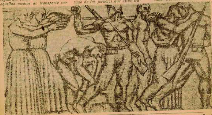
DOCUMENTOS HISTORICOS DE ESPAÑA

Federación Regional de Levante, Federación Regional del Centro y Federación Regional de Cataluña, Octubre de 1937.