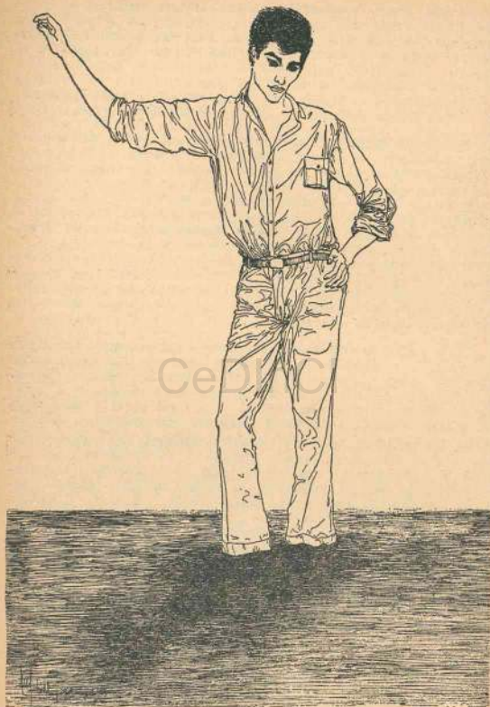
Dibujo de Federico Urdiano