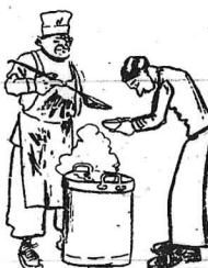
La única solución al problema de la desocupaci6n bajo la dictadura.