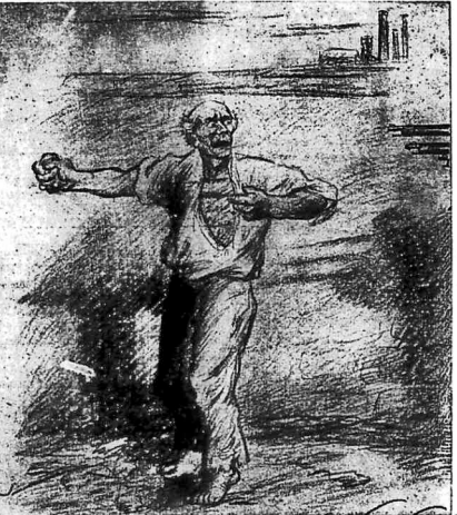
¿Qué tiene el proletario que perder en la rebelión? La vida la pierde también en la resignada mansedumbre, y la vida sin dignidad y sin provecho. Llegará la hora en que los trabajadores no se despondrán a la lucha para ser esclavos.

Por eso la sociedad humana, como la naturaleza, debe avanzar o retroceder. Y en la historia, como en la vida, hay que avanzar o retroceder. Y en la historia, como en la vida, hay que avanzar o retroceder. Y en la historia, como en la vida, hay que avanzar o retroceder.