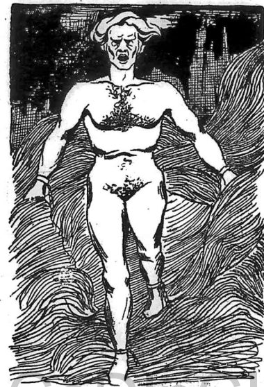
De las tinieblas de su ignorancia, el proletariado despertará para entrar en la historia a cumplir su destino.

persiste aún la zozobra y reina soberana la fuerza, la arbitrariedad y el martirio. Como en tiempos de la reciente tiranía se continúa castigando bárbaramente en el dantesco presidio de Ushuaia, se persigue y se balota con saña inusitada a los huelguistas y trabajadores de filiación libertaria en el interior, y otro tanto se hace en la metrópoli y en los pueblos suburbanos. La caduca ley 4144, llamada "de residencia", resucitada por el tirano Uruburu después de tantos años, intenta restaurar anunciándonos que se instituirá su vigencia permanente; el derecho que se cobijó un día de perder "nuestro credo" libertario en plazas y calles sin res-