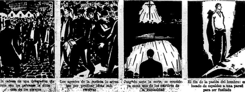
A la cabeza de una delegación que salió con los petates a discutir con los señores... El fin de la pasión del hombre: co-lonada de espalda a una pared para ser fusilado