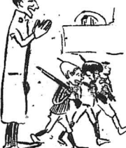
Escuela de Orimen