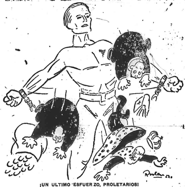
¡UN ÚLTIMO ESFUERZO, PROLETARIOS!

"Si me hubiera casado con un viejo vicioso e inválido, por poseedor de grandes riquezas, esos moralistas me hubieran llamado de alabanzas. "Yo prefiero la censura de esa sociedad moral que no puede comprender un verdadero amor, duplicado por la mancomunidad orgueolice de mis nuevos amigos, que son de ideas y por la desgracia. En cambio me personas capaces de apreciar un amor puro y desinteresado." (Nina Van Zandt. Joven de rica familia que asistió al proceso y llegó a enamorarse de uno de los acusados, Augusto Spies, con quien terminó casándose en la cárcel misma, algo antes de ser ahorcado).