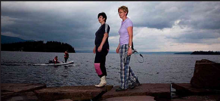
Dalen y Hansen, imagen the Seattle Lesbian.