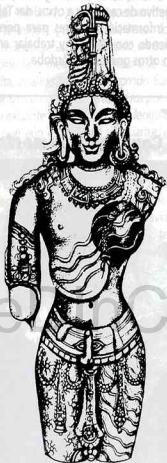
Ardhanarisvara, el Shiva andrógino, con el lado izquierdo femenino y el derecho masculino. Esta forma iconográfica sugiere la bisexualidad inherente a todos los seres humanos. De una escultura de piedra, siglo XII. Bengala.

No estamos indefinidas: somos mujeres bisexuales y eso también es una definición. No nos gusta cualquier cosa que se mueve: nos gustan ciertas mujeres, ciertos hombres y ciertas personas transgénero. No contagiamos el sida ni los valores patriarcales; en ambos casos, lo importante es LO que se hace y no CON QUIEN. Somos, por ahora, el grupo menos numeroso y visible de la tribu LGTB. Ojalá pronto dejemos de serlo y el año que viene haya también un varón bisexual hablando en este mismo lugar."