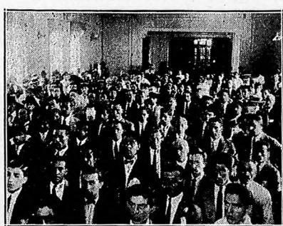
El mitin de la Casa del Pueblo organizado por el Sindicato Obrero de la Industria Metalúrgica.