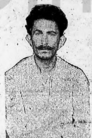
El defensor del compañero Mañasco en la tribuna.