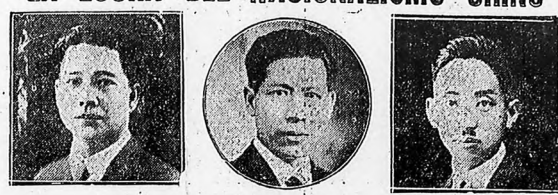
Wang Ching-wei, anteriormente presidente del primer presidente chino en Shanghai y hoy considerado uno de los principales dirigentes del partido Kuomintang.