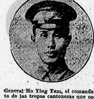
General Ho Xing-Yam, el comandante de las tropas del general Ho Xing-Yan, jefe del movimiento de propaganda anti-británica.