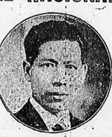
Chen-kuang-Poh, uno de los más famosos dirigentes de la propaganda nacionalista y jefe del gobierno chino en Hankow.