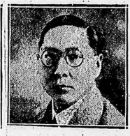
Sun Fo, hijo del ex presidente chino, General T'ao Yü-Kai, del estado ministro de Comunicaciones en el gobierno de Chang Kai-Shek y miembro del C. E. Nacionalista.