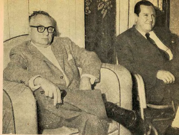
Rómulo Betancourt y Rafael Caldera —jefe de los democristianos— en una de sus frecuentes entrevistas