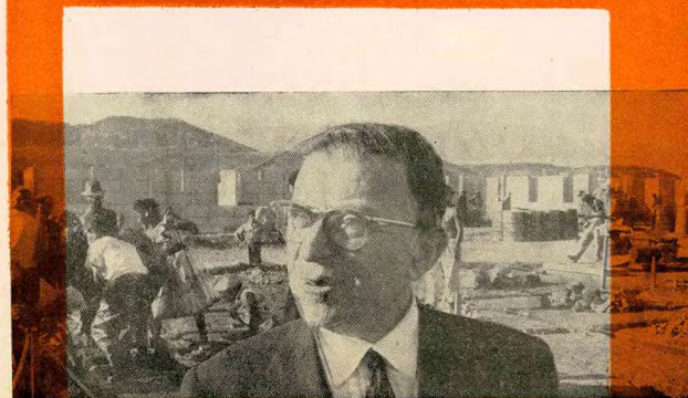
jean paul sartre opina sobre cuba