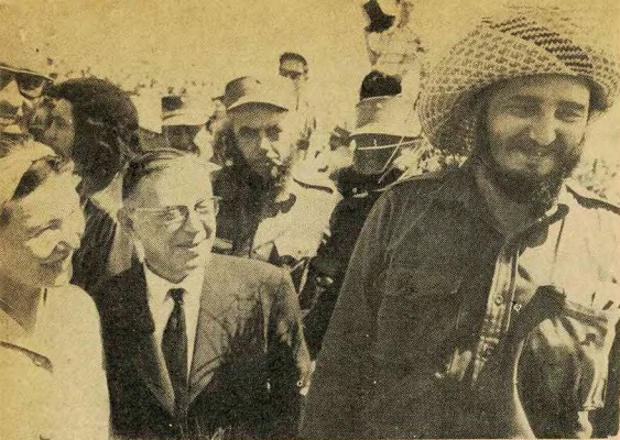
Jean Paul Sartre responde a las preguntas de los periodistas cubanos. A la izquierda, la novelista Simone de Beauvoir.