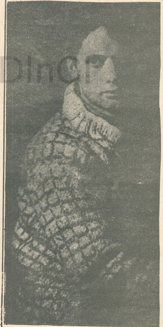
Dylan Thomas, en 1938

Así recuerdo que nunca debe haber existido una escuela como la nuestra: tan firme y gentil y con olor a galochas, con la dulce y vaporosa música de las lecciones de piano bajando las escaleras hasta la solitaria sala donde el solamen