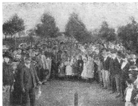
El grupo infantil

Por la tarde se acompañó á los estivadores en corpora-