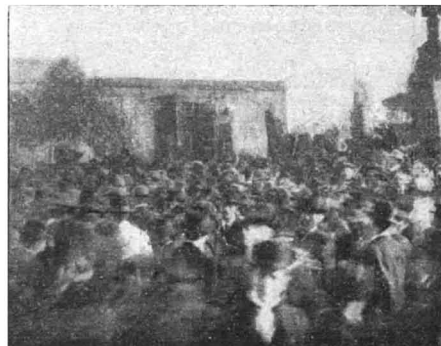
En la Plaza Santa Rosa.—Durante los discursos

SANTA FE. —He aquí los datos que recibimos de nuestro corresponsal. Día 1.º á las nueve a. m. manifestación de protesta. Punto de reunión: Plaza España. Forman la