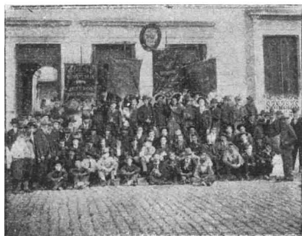
Villa Constitución.—Frente al local obrero

La manifestación organizada por la Federación Obrera, fué espléndida. Formaron la columna que desfiló en triunfo por las calles del Rosario, más de ocho mil hombres miembros de las siguientes agrupaciones: