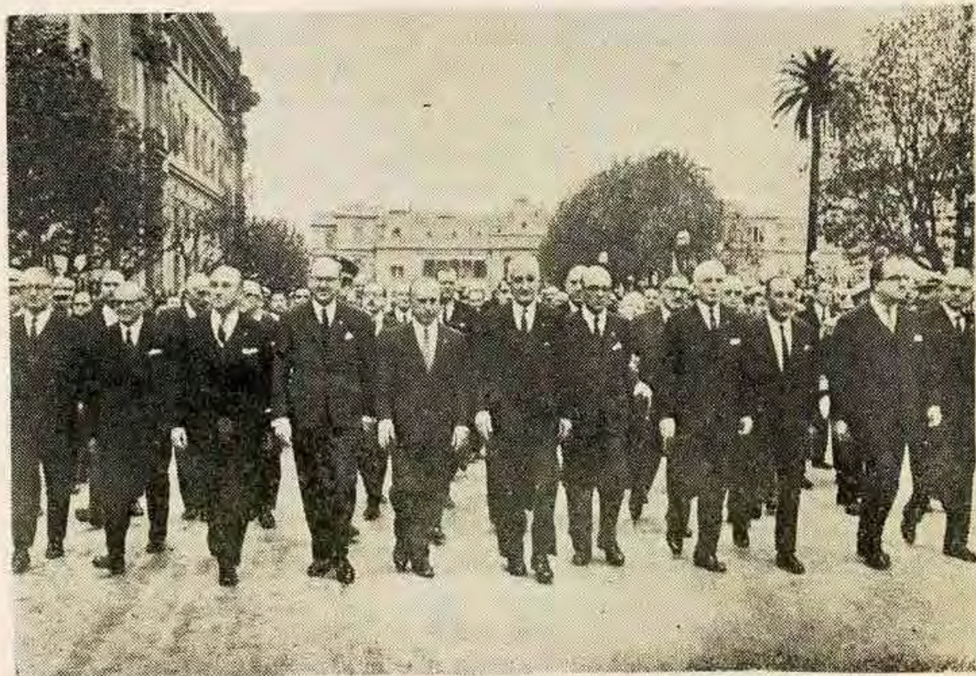
El poder político es masculino

Así como el estudio del racismo nos ha convencido de que existe una verdadera relación política entre las razas y las clases, y una situación de opresión de la cual el grupo dominado no puede liberarse organizando su oposición y lucha a través de las estructuras políticas convencionales, del mismo modo, cualquier examen inteligente y objetivo de nuestro sistema de política sexual o de las estructuras de los roles sexuales, probaría que las relaciones entre los sexos han sido y son de dominación y subordinación, por el derecho de control de un grupo por otro determinado por el nacimiento, el hombre manda y la mujer obedece. Durante toda la historia la mujer ha estado en la misma situación que los grupos minoritarios oprimidos, aún después que consiguió, a regañadientes, la obtención de ciertos derechos civiles mínimos y