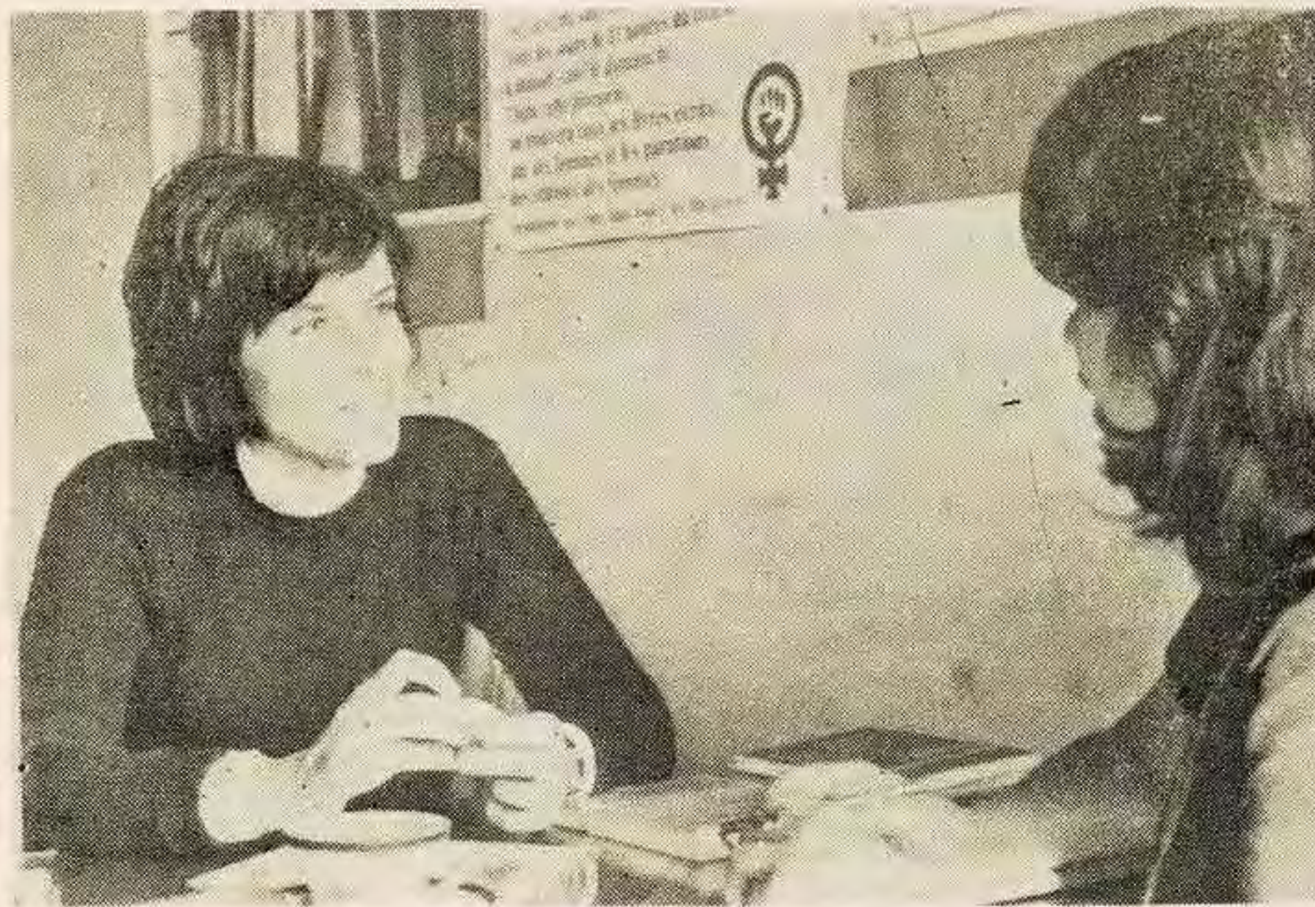
María Luisa Bemberg en nuestra redacción