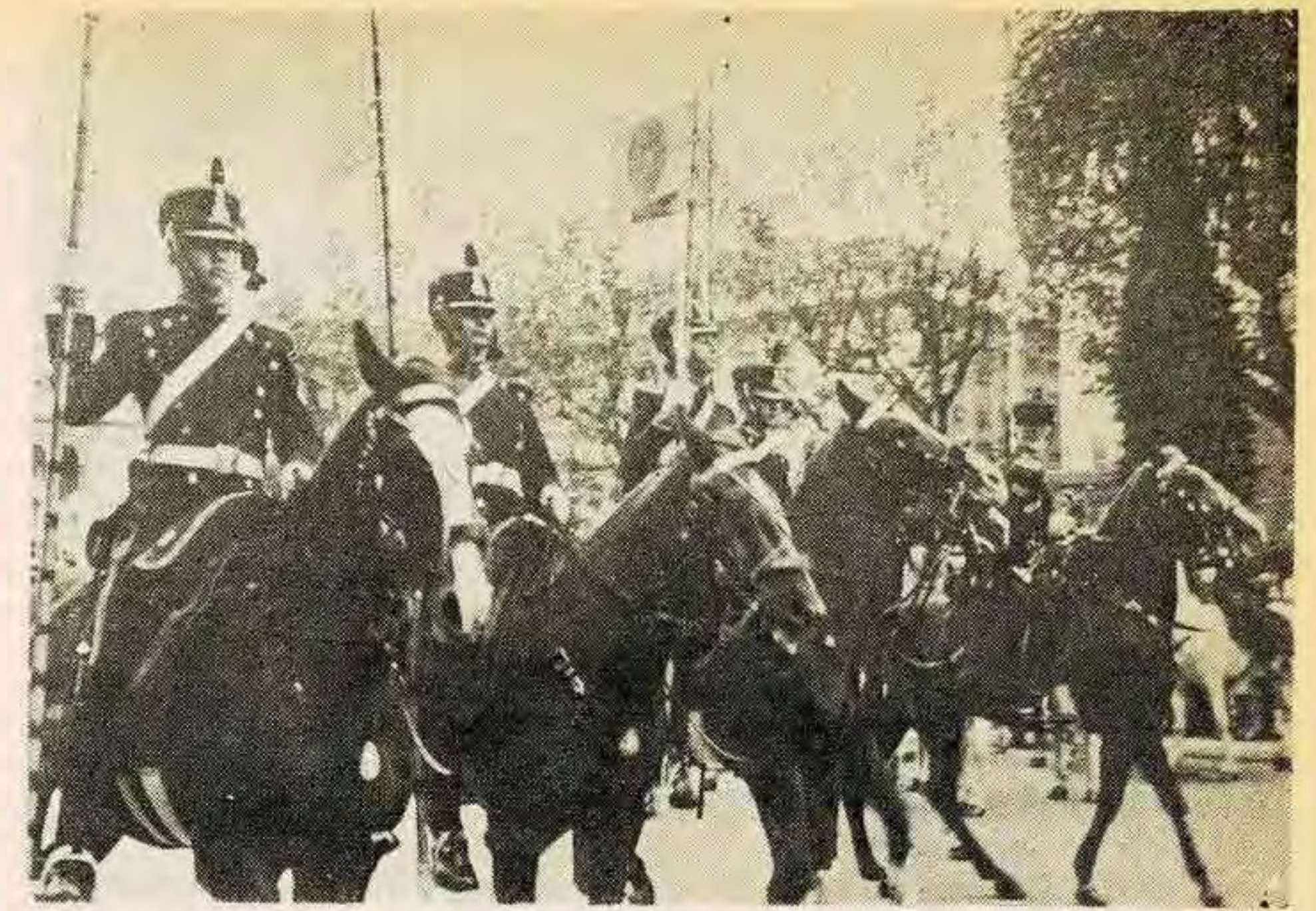
El poder militar es masculino

del sufragio, a principios de siglo. Es erróneo pensar que las mujeres tienen mayor representación ahora que votan, que antes. La historia señala claramente que en los últimos cien años, el derecho al voto no cambió la condición de las mujeres.