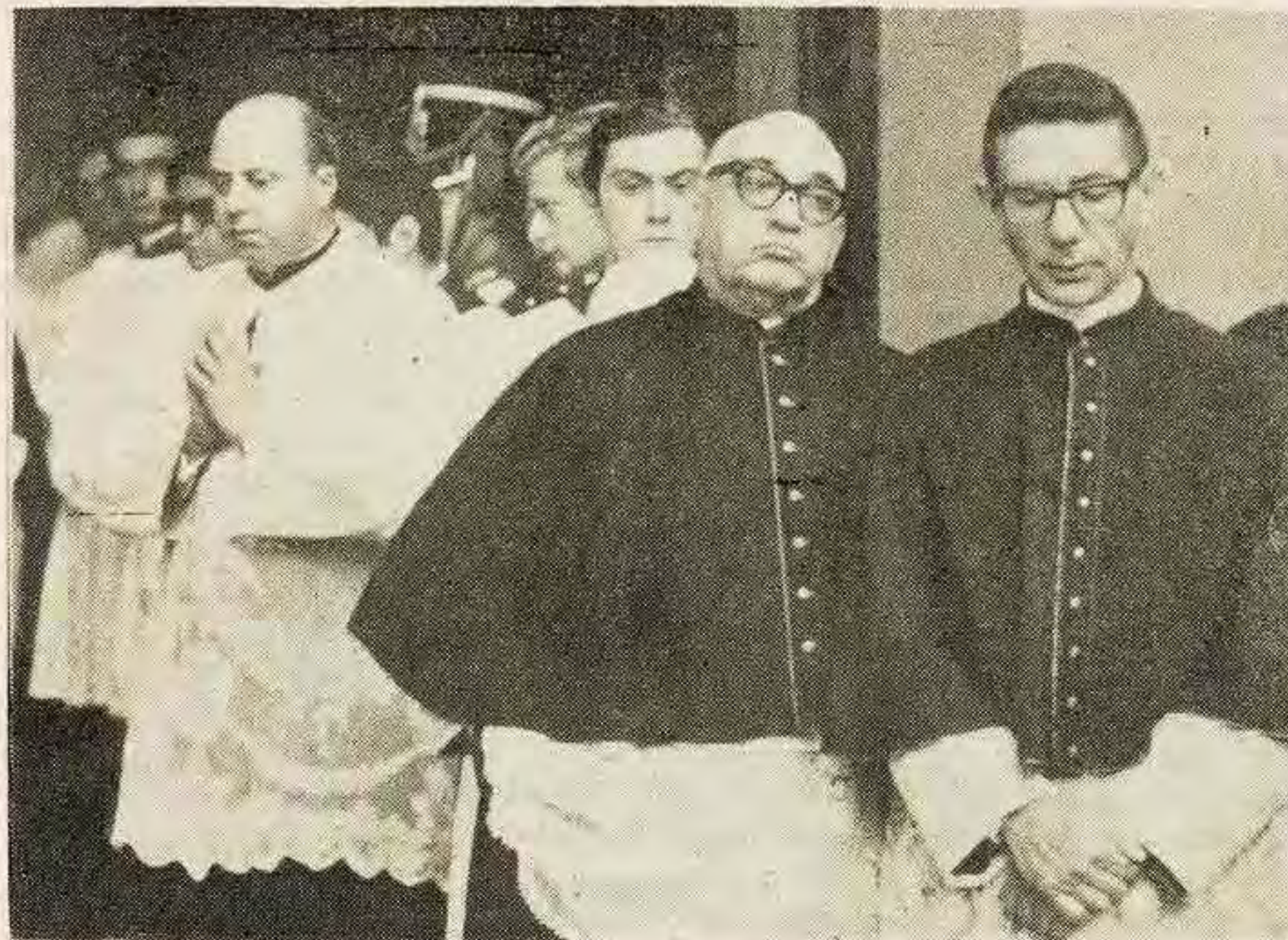
El poder religioso es masculino

Como en toda sociedad en estado de guerra, el cumplimiento de la ley masculina, se mantiene con las mismas mentiras que se usan en los países en guerra: el enemigo es el mal, el enemigo no es humano. Y los varones siempre han creído en la maldad innata de las mujeres. El estudio de las sociedades primitivas coincide con nuestros textos religiosos en los innumerables casos de tabúes practicados contra las mujeres. La mujer menstruante es impura, intocable, no puede tener acceso a las armas, se le prohíbe la entrada al templo según nos informan fríamente los Evangelios. Aunque haya dado a luz al Salvador del mundo debe purificarse para entrar al templo. ¿Han pensado alguna vez lo curioso que es que las poluciones nocturnas nunca se consideraron sucias o misteriosas que el pene nunca se considera sucio sino tan