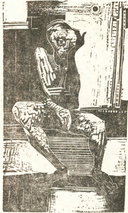
Ilustró Abel Bruno Versacci

Quiero el espanto de saber lo último que no se dice.