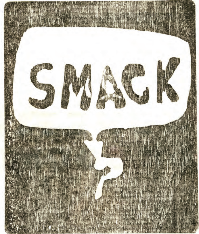
REALISMO NARRATIVO (1966)

BOING BOING BOING BOING BOING BOING BOING BOING BOING BOING BOING BOING BOING BOING BOING BOING BOING BOING BOING BOING BOING BOING BOING BOING BOING BOING BOING BOING BOING BOING BOING BOING BOING BOING BOING BOING BOING BOING BOING BOING BOING BOING BOING BOING BOING BOING BOING BOING BOING BOING BOING BOING BOING BOING BOING BOING BOING BOING BOING BOING BOING BOING BOING BOING BOING BOING