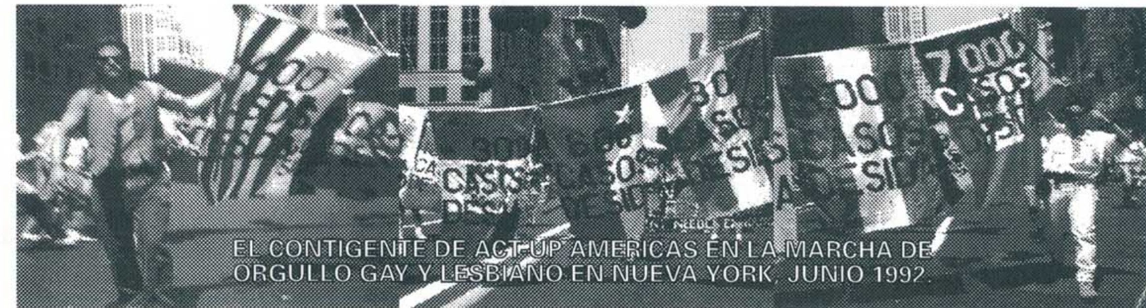
EL CONTINGENTE DE ACT-UP AMERICAS EN LA MARCHA DE ORGULLO GAY Y LESBIANO EN NUEVA YORK, JUNIO 1992.

El grado de extensión de la epidemia en los EE.UU. así como la falta de políticas coherentes por parte del gobierno federal, ha forzado a las organizaciones de servicios, profesionales de la salud y activistas a concentrar energías en la lucha por la rápida aprobación de drogas, la inclusión de grupos minoritarios y mujeres en los experimentos y la defensa de los derechos civiles. En este contexto parecería injusto esperar que el activismo dedicara tiempo y esfuerzos involucrandose en la situación de las personas con SIDA en América Latina y el resto del continente.