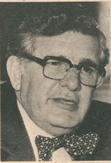
Jorge Turbay Ayala

con países amigos». Para el caso colombiano, dice el mismo periódico: «En honor a la verdad hay que decir que de un tiempo a esta parte, algunos jefes militares, cuyo número es reducidísimo, han tratado de impedir que a los altos puestos de comando lleguen generales que posean ideas de avanzada, mejor aún, que puedan ejercer actividades «liberalizantes» dentro de las filas castrenses».