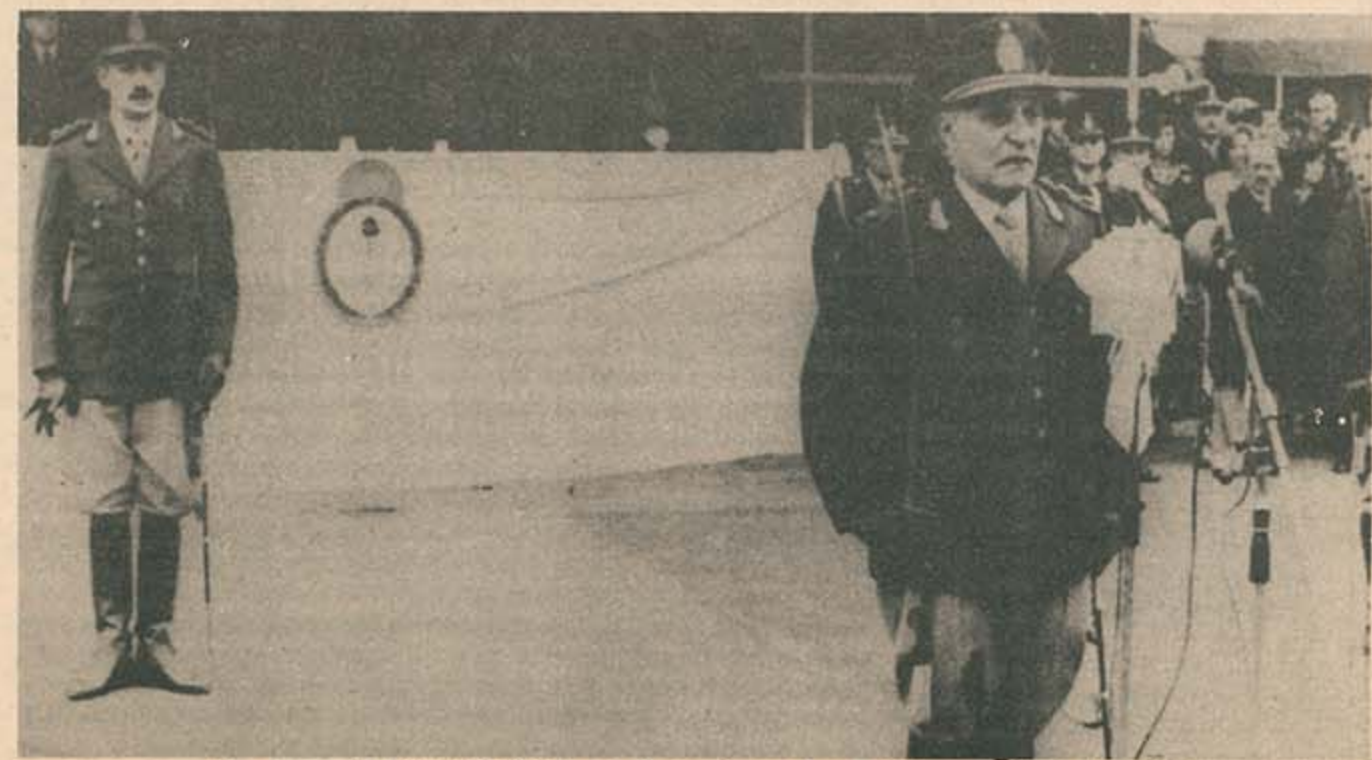
Los generales Viola y Videla, al abrigo hasta ahora de la condena de la ONU.

Las resoluciones públicas de organismos de las Naciones Unidas sobre los derechos humanos en Argentina son hasta ahora cuatro. Sólo en una de ellas se menciona a la Argentina por su nombre. Es un pronunciamiento de la Subcomisión de Prevención de Discriminaciones, primera intervención de un organismo del sistema de Naciones Unidas en el drama argentino (agosto de 1976). La Subcomisión se limita a considerarse «profundamente preocupada» porque los derechos humanos peligran en ese país, expresa la esperanza de que las normas internacionales sean respetadas y formula un llamamiento para la reincidencia de refugiados. Habrá que esperar hasta diciembre de 1978 para que la Asamblea General, por unanimidad, apruebe una resolución —la segunda sobre el tema— relativa a las «personas desaparecidas», pero esta vez sin mencionar países. ¿Qué ha pasado entre tanto?