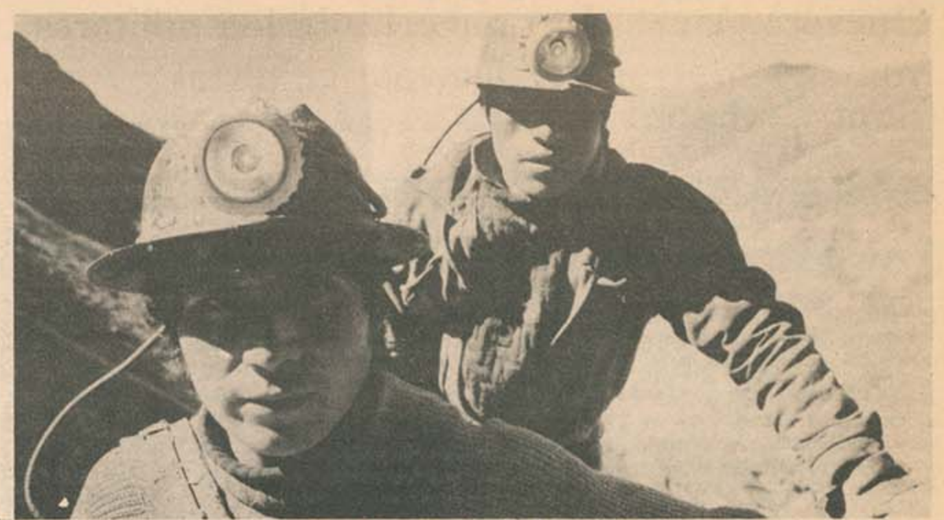
La COB en su punto más alto de combatividad

A los revolucionarios de este país les interesa poco si el proceso libera-