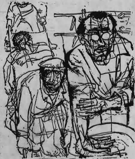
«LOS HERIDOS» Lajos Szalay

En él se aúnan el artista y el artesano. Lo dice la búsqueda incansable que se adviene en sus cuadros, la inquietud que lo lleva a rastrear posibilidades por medio de la línea, el color, la construcción. Los resultados son satisfactorios: en Brusau hay poco puesto al azar y de lo logrado a través de la búsqueda se desprende una sólida ligazón de lo inmediato con lo elaborado. Con una gama tonal mas bien baja y si se quiere un po-