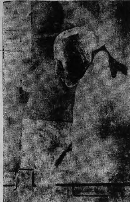
«FIGURA» Pedro De Simone, oleo