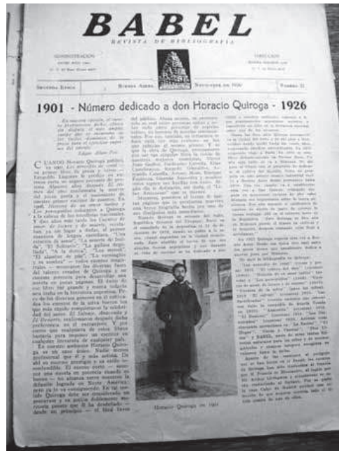
Revista Babel . Revista de bibliografía. N° 21, noviembre 1926. CEDINCI, Argentina.

De lo anterior se desprende que el grupo intelectual cercano a Glusberg expuso una tendencia hacia ideas ácratas, las cuales cumplieron un rol importante al momento de analizar las ideas que intentaba difundir a través de su revista en cada política cultural emprendida por el director de Babel . No obstante, de la misma manera se observa que Glusberg no tuvo problema en apoyar las obras literarias de Lugones y de escritores que no seguían la misma tendencia libertaria que él, ya que en este período Babel se centró en el aporte literario más que en la discusión política.