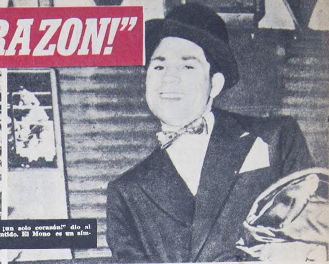
Diez cuadros densos acompañaron a Gatica desde la FAE hasta el cementerio de Avellaneda. El pueblo llevó en andas la gran corona que el General Perón enviara a quien fue una auténtica expresión de las masas argentinas. Por eso el grito de "Gatica, Perón, ¡un solo corazón!" dio al maná su exacta dimensión, su profundo sentido. El Mono es un símbolo que no perecerá.

CARNE: CARA PARA LOS ARGENTINOS BARATA PARA LOS INGLESES