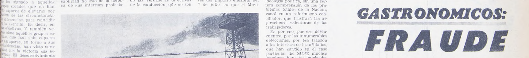
El problema de la unidad... El desmoronamiento de los sindicatos...

EL PROBLEMA DE LA UNIDAD... UN CUERPO DE BUOCRATAS