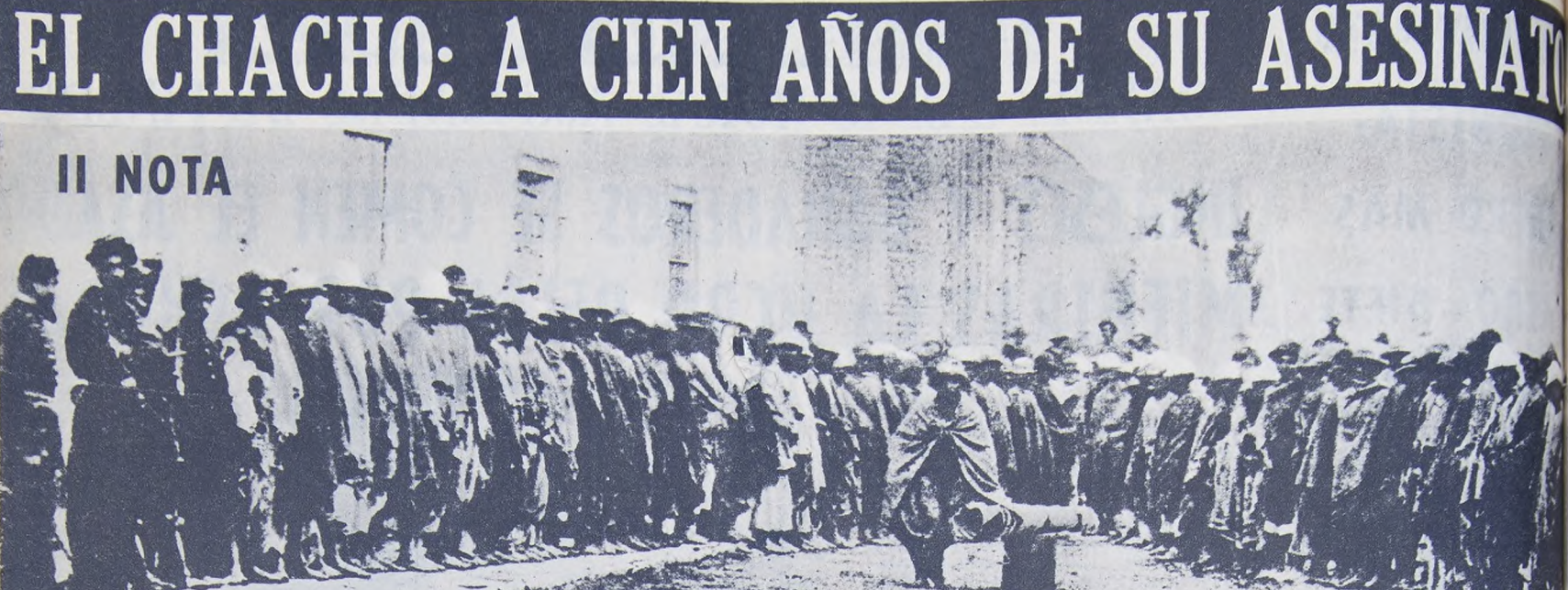
EL CHACHICO: A CIEN AÑOS DE SU ASESINATO... Hoy, a cien años de aquel asesinato, cuando los Linarios...