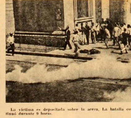
La víctima es depositada sobre la acera. La batalla continuó durante 9 horas.

ritmo de quebradas de las empresas nacionales alcancen un promedio de 150 semanas. Además, siguiendo las directivas del F.M.I., se rebajó en un 10% el sueldo a obreros y empleados, se aumentaron los alquileres, se paralizó la industria de la construcción, dejando en la calle a 250 mil familias y se despidió a 20.000 empleados. En la actualidad, hay 600.000 desocupados sobre 4.000.000 de personas en condiciones de trabajar. Ni que decir que las dos mayores compañías petroleras, la Creole (dependiente de la Standard Oil) y la Shell, gozan de una situación de privilegio, beneficiándose con la