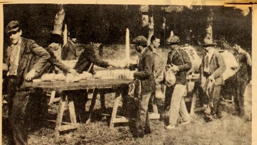
1930-1943: la oligarquía en el poder ha impuesto su política de hambre, y desocupación. 1953-1962: los mismos autores, el mismo resultado.