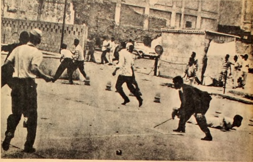
Durante una demostración de protesta contra la desocupación en la Plaza de la Concordia de Caracas, los manifestantes se defienden a pedradas de la violenta represión policial. 7 muertos y 250 heridos fue el trágico saldo del desigual combate.