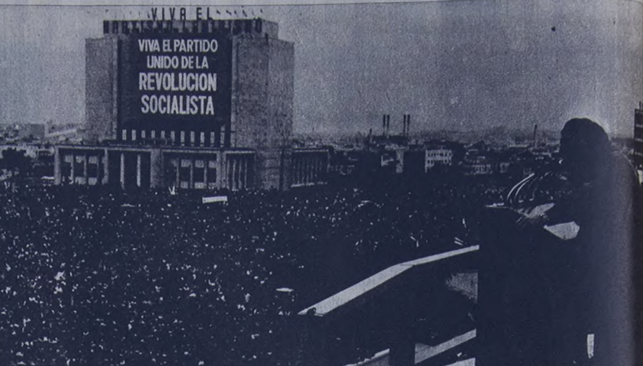
Fidel Castro habla al pueblo cubano en la Plaza de la Revolución en el segundo aniversario del triunfo sobre los invasores yanquis de Cochinos.

■ LA GALERÍA DE LOS CIPAYOS Un examen a vuelo de pájaro del actual panorama político guatemalteco, es propio para pintar una muy negra galería de la infamia cuya réplica, poco o más o menos, puede encontrarse en cualquier otro lugar de Latinoamérica. Juan José Arévalo fue presidente del país hace unos años. Fue un gobierno de intelectuales inocentes, "progresistas" y "demócratas". Su imperio jamás no pasó nunca de lo declarativo y, mientras discursaban sobre los beneficios de la educa-