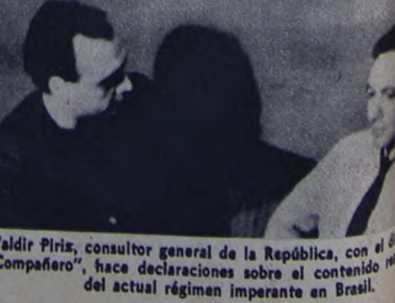
Waldir Pires, consultor general de la República, con el "Compañero", hace declaraciones sobre el contenido del actual régimen imperante en Brasil.

"Quiero aprovechar esta oportunidad para agradecer a los trabajadores argentinos, a la juventud argentina, a la salutación amiga y nuestra admiración por su lucha por la muestra en la solidaridad de un destino común. Más aprovecho la presencia en esta entrevista, de un compañero de COMPAÑERO, para hacer llegar mi saludo a los compañeros del semanario y mi agradecimiento por el esfuerzo realizado".