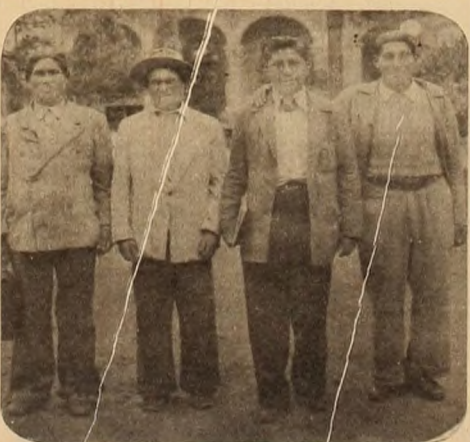
Delegados coyas en Salta, frente a la Casa de Gobierno, a la que llegaron en pos de sus problemas.

A veces se nos concede un "Bueno, luego veremos". No, luego no, ahora, ya. Primero, porque sino se desdena un formidable yacimiento revolucionario. Segundo, porque las experiencias indican lo siguiente: en la Rusia zarista la cuestión nacional se planteó antes de la Revolución con los buenos resultados conocidos. En Indonesia la cuestión nacional y racial ya se ha planteado antes de la revolución con el feliz resultado de que las minorías nacionales y raciales ven sus aspiraciones reflejadas