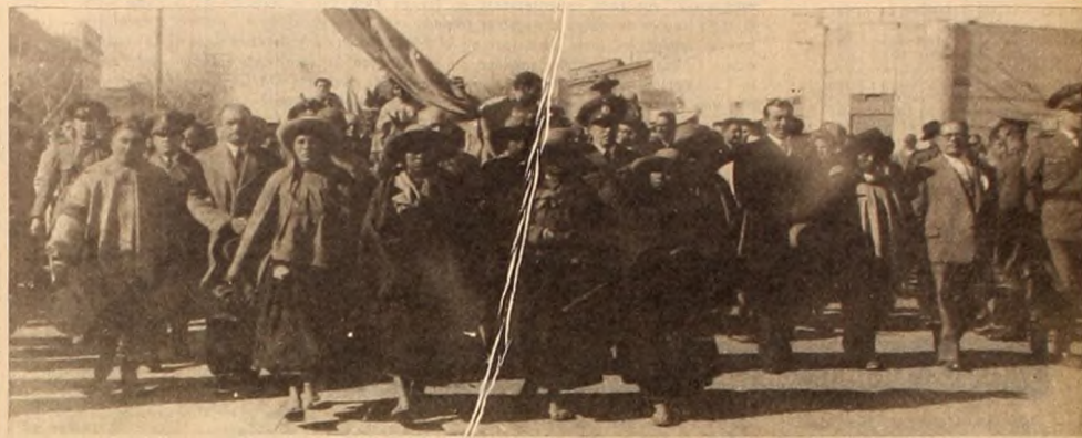
Mujeres coyas que desafiando el cansancio marcharon a reclamar las tierras de sus antepasados. En el programa revolucionario y se incorporan a la lucha y por otro lado se eliminan roces entre revolucionarios. En fin, si no se plantea el problema previamente no sólo se limita la tarea revoluciona-

Para ello —y aunque parezca obvio, aún no lo es para muchos seudorrevolucionarios— es necesario reconocer que los indios y los nativos son iguales a todos, que a ellos se les aplica como a cualquiera el prin-