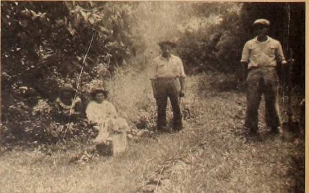
En la actualidad, a los coyas se les entierra en el monte, como este "angelito".