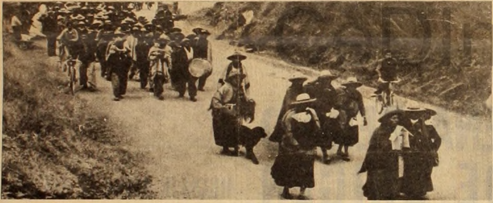
Otra escena de la caravana de indios jujeños que piden se solucionen las duras condiciones económicas y sociales en que viven.

5) Usan ojotas o husutas. Son identidades culturales demasiado directas, ninguna de las cuales fue traída por los españoles.