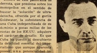
Ernesto "Che" Guevara: "Cada día crecerá con mayor fuerza el sentimiento de rebeldía de los pueblos sujetos a la explotación imperialista y se alzarán en armas para conquistar por la fuerza lo que el ejercicio de la razón no les permitió obtener".