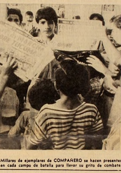
Millares de ejemplares de COMPANERO se hacen presentes en cada campo de batalla para llevar su grito de combate.