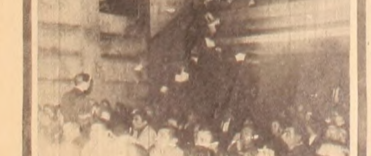
EL 5 DE AGOSTO, el peronismo revolucionario aprueba los históricos documentos y declara su vocero a "COMPANERO".