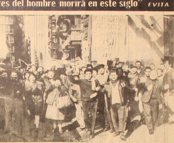
Frete a las ya insostenibles condiciones de vida, el gremio textil se ha lanzado a la lucha por mejores salarios. Ante la combatividad de las bases, el gobierno se olvida de su proclamado "pacifismo" y los reprime violentamente.

En esta situación los sorprenden un decreto del Ministerio Nacional de Trabajo, ordenando la realización del acto electoral para la renovación total de autoridades. Este llamado se complementa y vincula con otro impacto: aumento del 60 por ciento concilio, a iniciativa de la propia patronal. ¿Qué pasa? El secreto es el siguiente: el gobierno provincial Radical del Pueblo represente nta fundamentalmente los