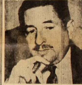
Abrieron usufructuadas posiciones otorgadas graciosamente por el pueblo.