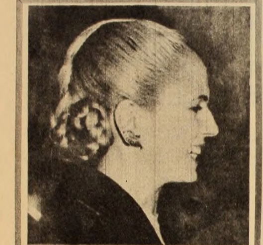
Eva Perón, Vigia de la Revolución y abanderada del Pueblo.

No es una novedad que la incapacidad del régimen para llevar a cabo a los trabajadores a un convenio salda. Hoy los miles de trabajadores de los Astilleros Navales de Río Santiago sufren las consecuencias de dicha incapacidad. Miles de trabajadores, que tienen una capacidad para construir buques de hasta 40.000 toneladas y entregar asistidamente dos barcos, son amasados en esterilidad y non sula el trabajo de todo su personal. Quien sabe generoso de ello no el país ni los trabajadores, sino los pulpos del transporte marítimo inglés.