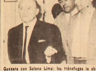
Gazzeria con Solano Lima: los tráfugas le abren la puerta a la oligarquía a través del frentismo.