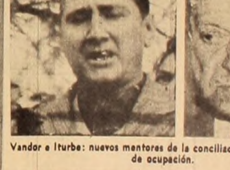
Andor e Iturbe: nuevos mentores de la conciliación con las fuerzas de ocupación.