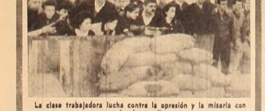
La clase trabajadora lucha contra la opresión y la miseria con todos los medios.