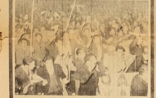
Las masas en la calle son la garantía del triunfo sobre la reacción.