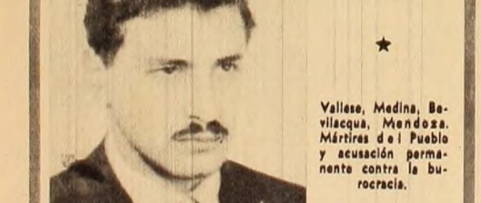
Vallese, Medina, Bevilacqua, Mendoza, Mártires del Pueblo y acusación permanente contra la burocracia.