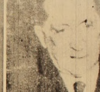
El símbolo máximo de la infamia y la tralación de la burocracia: Tel. seire.