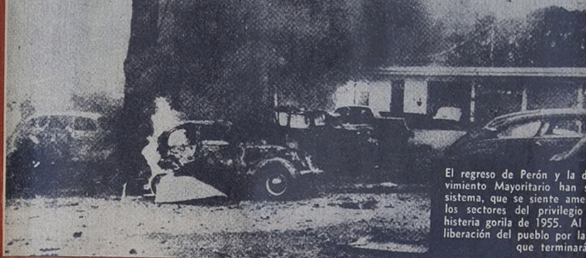
El regreso de Perón y la definición revolucionaria del Movimiento Mayoritario han sacudido hasta los cimientos al sistema, que se siente amenazado de muerte. El miedo de los sectores del privilegio ha hecho aflorar otra vez la histeria gorila de 1955. Al pretender ahogar la voluntad de liberación del pueblo por la violencia, encienden la hoguera que terminará por consumirlos.