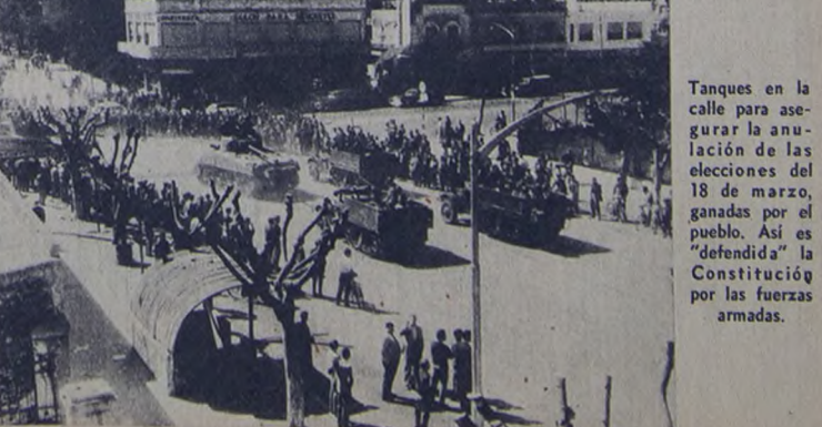
Talques en el campo para asegurar la anulación de las elecciones del 18 de marzo, ganadas por el pueblo. Así es "defendida" la Constitución por las fuerzas armadas.