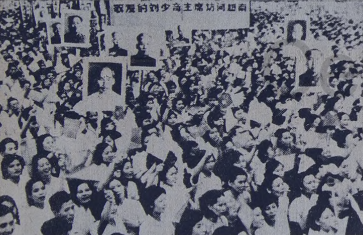
Todos los intentos del imperialismo yanqui para someter definitivamente a Vietnam chocan con una realidad: la unidad indestructible del pueblo en torno a las banderas de la Liberación.

Como se recordará, el general Diem fue el hombre elegido por el Pentágono para llevar adelante el experimento. Diem fue el hombre que los yanquis encontraron en Saigón una vez que los franceses arrojaron la bandera. Parecía el ejemplar adecuado. Inflado por los dólares de la "ayuda exterior" y sostenido por las bayonetas de los yanquis, Diem