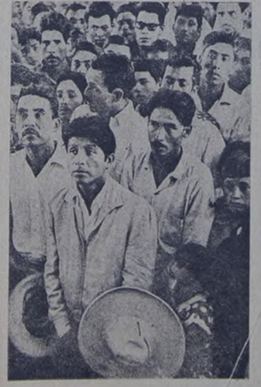
Masas indias que protagonizaron la revolución mexicana, inconclusa aún, en la cual los episodios evocados en esta nota fueron elemento positivo en la recuperación de su soberanía.

La Standard Oil publicó un semanario en inglés —llamado "The Lamp"— con el fin exclusivo de denigrar a México. Por su parte todo el pueblo mexicano se movilizaba junto a los trabajadores del petróleo.