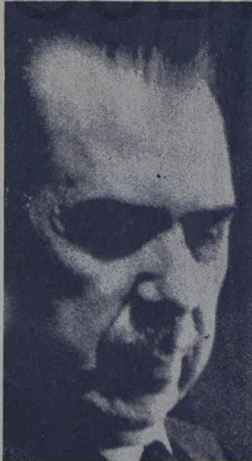
El general Lázaro Cárdenas, presidente de México en el año 1938, respondió a los anhelos de su pueblo en su lucha contra el trust internacional del petróleo.

nicanas bajo leyes mexicanas, pretende eludir los mandatos y las obligaciones que le imponen autoridades del país."