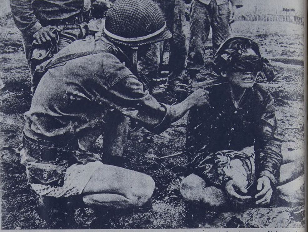
Los yanquis y su ejército títere de Vietnam pretenden intimidar al pueblo con la violencia brutal. Con el arma amarrillada pretenden "convencer" a la población, como en este caso a un guerrillero que es casi un niño, de las "bondades occidentales y cristianas" del imperialismo. El desarrollo de la lucha demuestra que estos métodos no sirven cuando el pueblo se decide a dar la batalla.

Continúa en Saigón la movida "danza" de los títeres del imperialismo yanqui. Esta vez ha permanecido, aunque maltracho, en el gobierno Nguyen Kahn, después de soportar un golpe de estado que, según todos los indicios, provino de los sectores católicos, disgustados por las concesiones que Kahn ha debido hacer a los budistas y los estudiantes. Hace muy poco tiempo los cables informaron acerca de los violentos disturbios promovidos por los estudiantes sudvietnamenses, que obligaron al "gobierno" a promover numerosos cambios en los organismos militares. Los acontecimientos recientes constituyen pues, la reacción contra aquellos nombramientos y revelan —una vez más— el estado de descomposición en que se debate la pequeña casta proimperialista de Saigón, artificialmente sostenida por Washington a costa de un drenaje de un millón y medio de dólares diarios. La complicada madeja del Vietnam del Sur se embrolla cada vez más por los intereses imperialistas. El dorado sueño del Pentágono de armar un estado anticomunista "modelo" que sirviese de ejemplo de los métodos occidentales y, a la vez, de base de operaciones para reprimir el avance de los movimientos de liberación en el sudeste asiático —y cercar a China—, está haciendo agua por todos los costados.