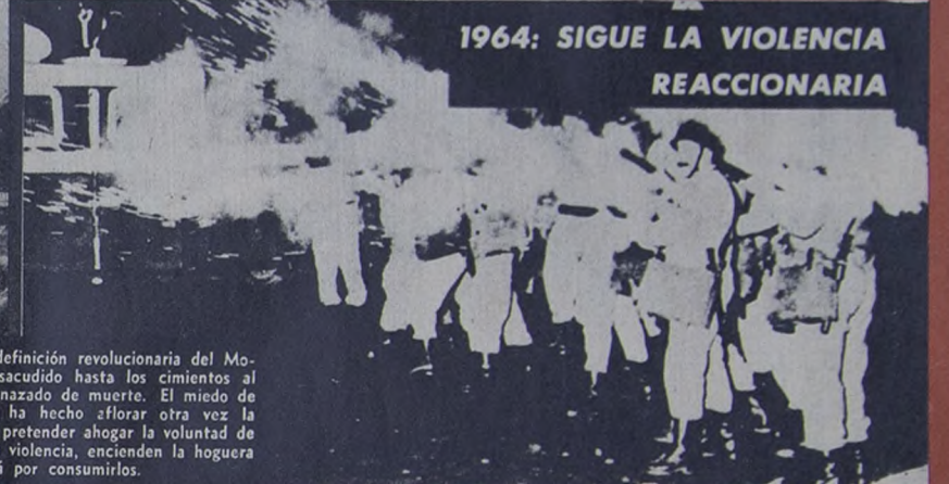
1964: SIGUE LA VIOLENCIA REACCIONARIA