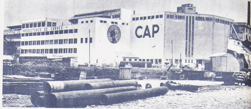
Los frigoríficos cumplirán su misión cuando sean nacionalizados. Por ahora están en la gran estafa al pueblo, encaucando artificialmente la carne y cobrando dividendos fabulosos.