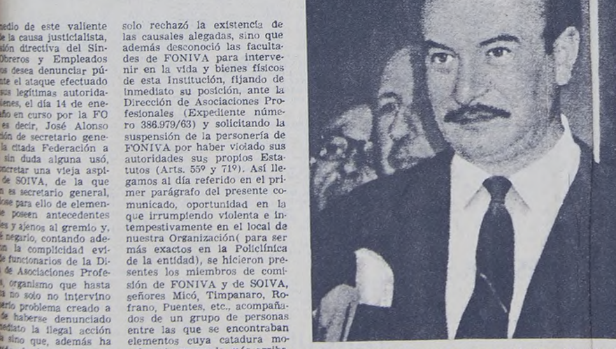
Alonso: envió a sus matones para apoderarse del edío del Sindicato de Botoneros, pero tuvieron que retirarse ante la movilización del gremio.

Sindicato Obrero y Empleados Botoneros hizo llegar un comunicado que denuncia el bárbaro ataque efectuado contra sus legítimas autoridades por los peroneros y matones de José Alonso.