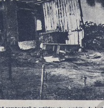
Villas como éstas no deben provocar "caridad compasiva" y estética sino espíritu de lucha para acabar con el sistema que las produce.