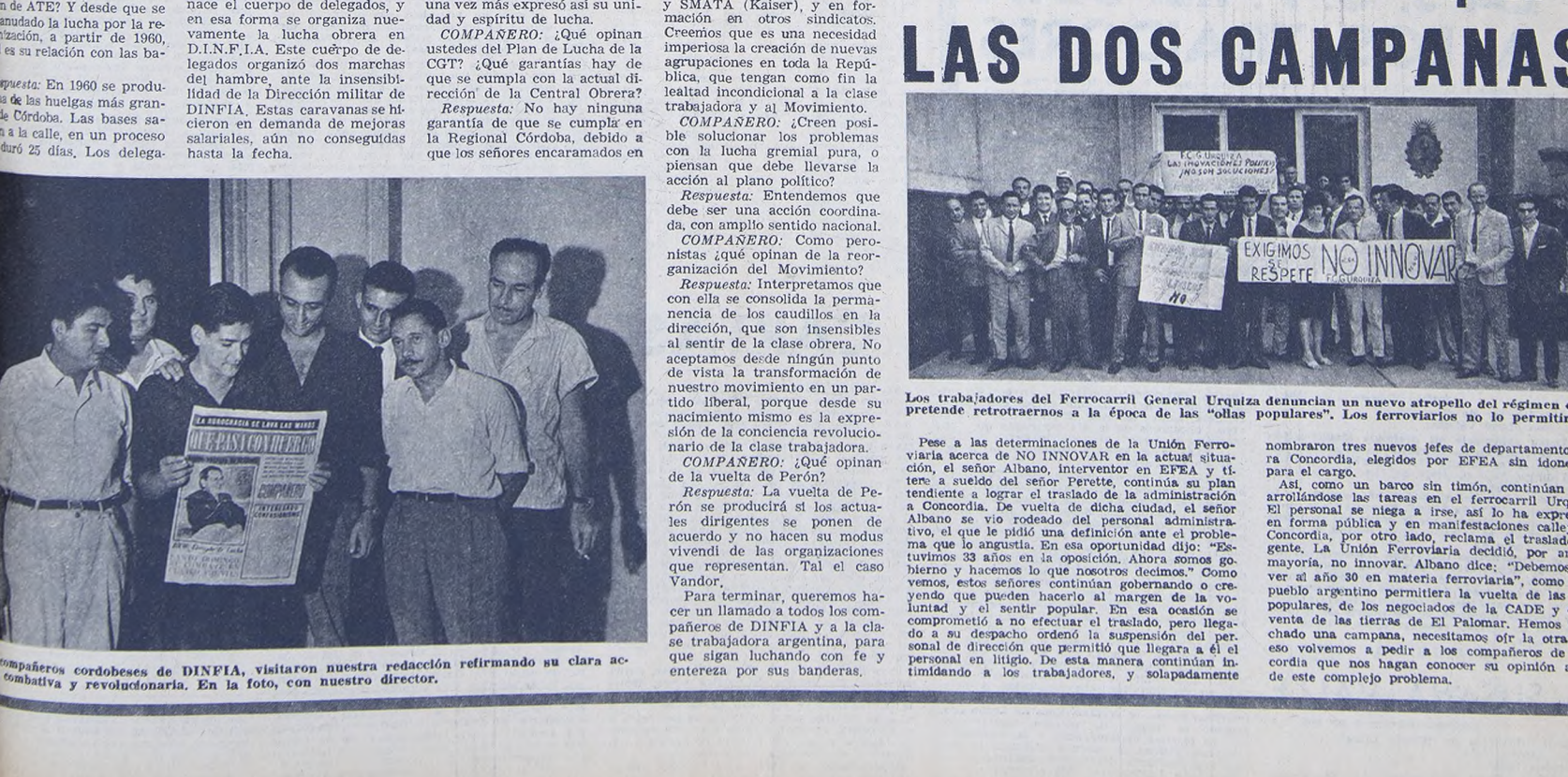
Los estudiantes deben sumarse en la práctica a las luchas de la clase trabajadora, sumando sus banderas que son las de la Liberación Nacional.