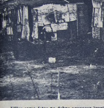
Villas como éstas no deben provocar "caridad compasiva" y estética sino espíritu de lucha para acabar con el sistema que las produce.