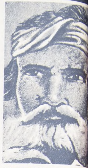
El Chacho Peñaloza, asesinado por Baring Brothers, Mitre y Sarmiento. Su asesinato fue el primer paso a los banqueros londinenses.