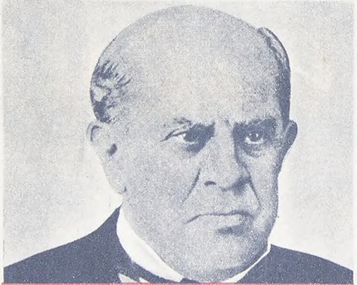
Domingo Faustino Sarmiento, hijo de las maestras normas del imperialismo, combatió a los ferrocarriles británicos.