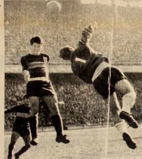
En el tiempo del gobierno popular peronista, el deporte, como todas las expresiones de la vida nacional, se desarrolló en plenitud. Se dieron las condiciones para que ese gran factor de cohesión nacional que es el deporte cumpliera su misión.

las posibilidades actuales de la masa popular. Hoy juegan al golf, mañana el pueblo les hará llevar los palos. Y esto ya lo demostró el peronismo.