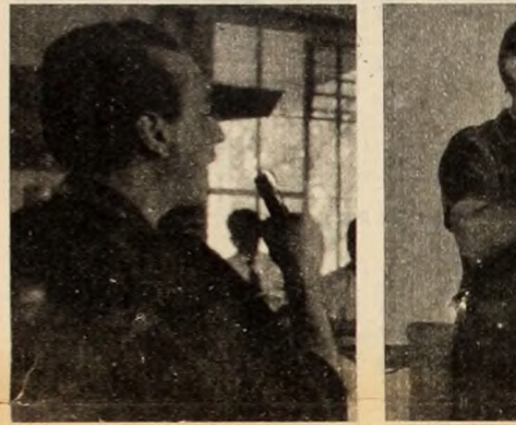
Valotta: "No hay peronismo sin Perón"