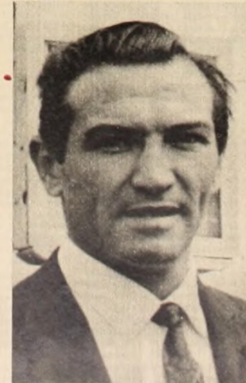
Juan Manuel Fangio y Pascualito Pérez: todo un símbolo. Sus grandes éxitos se produjeron cuando