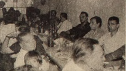
Marcos Juárez: "Perón volverá porque esa es su voluntad y la voluntad del pueblo"

En la foto se aprecia un aspecto parcial de la comedia de camaradería ofrecida a COMPASERRO por el PAR y otras organizaciones revolucionarias del peronismo de Córdoba. Los numerosos concurrentes demostraron su gran espíritu de lucha y su unidad en torno al Líder indiscutible de los trabajadores, General Juan D. Perón.