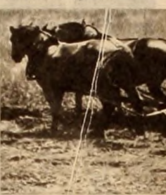
Un minúsculo grupo de latifundistas posee el 70 por ciento del total de las tierras. Sólo una profunda y auténtica reforma agraria devolviendo la tierra a los que la trabajan, terminando con el asistencialismo que se ejerce en el campo de la oligarquía.

Comencemos por señalar que en nuestro país, el 1% de la población económicamente activa del sector agropecuario, posee el 70% del total de las tierras. El siguiente cuadro del censo agropecuario de 1962, dará una idea más clara del problema: