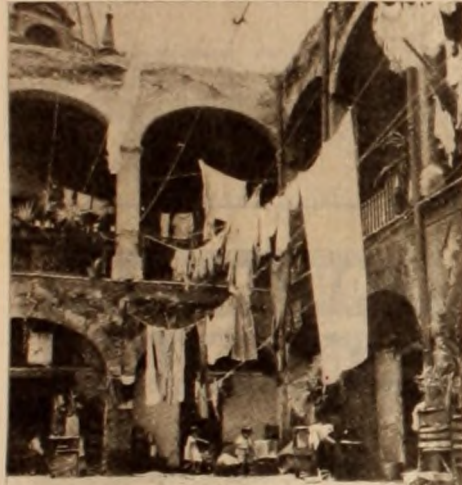
Sórdidos conventillos donde viven hacinadas decenas de familias en condiciones de insoportable promiscuidad.

respetado celosamente la "tesis" de la ganancia empresarial. Nos hemos puesto, si se quiere, en el punto de vista "capitalista", ya que, al fin de cuentas, el parasitismo de la vivienda exige mayores salarios inútiles para alimentar a los rentistas, acrecienta los costos de capitalización. En todo el análisis, asimismo, no nos hemos salido del marco injusto de la propiedad privada, reaccionando, precisamente, contra un régimen que despoja de vivienda a las 9 décimas partes de la