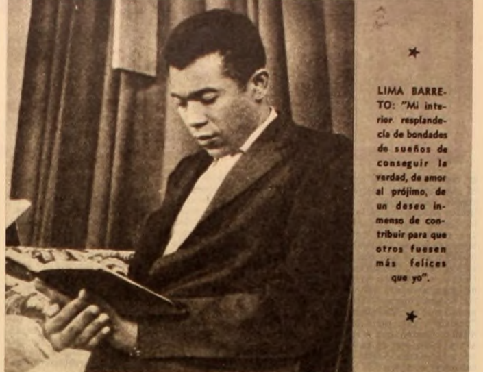
LIMA BARRETO: "Mi interior resplandecía de bondades de conseguir la verdad, de amor al prójimo, de un deseo inmenso de contribuir para que otros fuesen más felices que yo".

Generalmente se vio precisado a publicar sus escritos con sus propios medios, por cierto escasezados, dado que su existencia se desarrolló en la más aguda pobreza hasta la llegada de su lamentable desaparición a la edad de 41 años, rodeado de una inmensa soledad. Con motivo de cumplirse este año el 82º aniversario