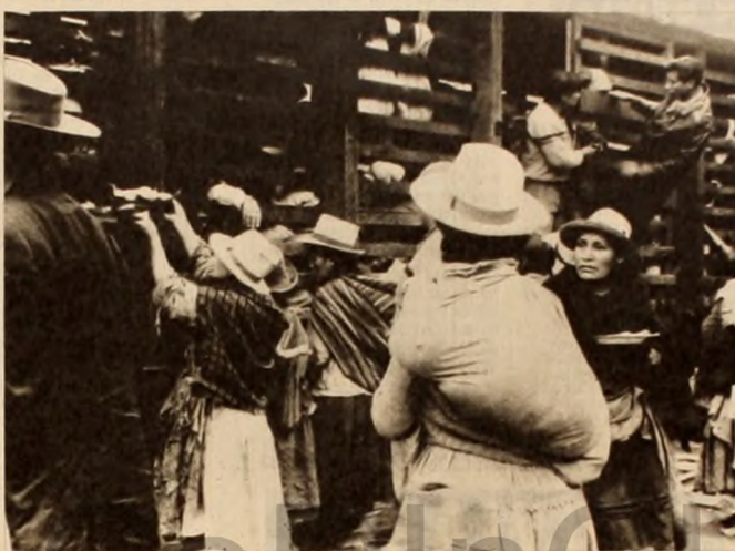
Este documento gráfico y las manifestaciones de un testigo directo denunciadas en esta nota, demuestran las promesas hechas al embajador del país hermano, Bolivia. Los braceros son marcados y arreados como ganado a las argasinas del Norte.

En las tierras subtropicales del extremo norte del país, con capital proporcionado por los bancos oficiales, y mediante créditos obtenidos en volúmenes que solamente justificaban las posiciones políticas, apropiándose discretamente de las aguas de nuestros ríos y explotando en forma feroz y desplazada la mano de obra indígena o el atraso y la miseria en que viven los campesinos del sur de Bolivia, se han desarrollado algunas factorías azucareras que a la sombra del proteccionismo estatal, permanentemente influido o manejado por ellos y aprovechando precios de ventas establecidos sobre los costos superiores de otras zonas, disponen hoy de un poderío que los convierte poco menos que en estados dentro del Estado.