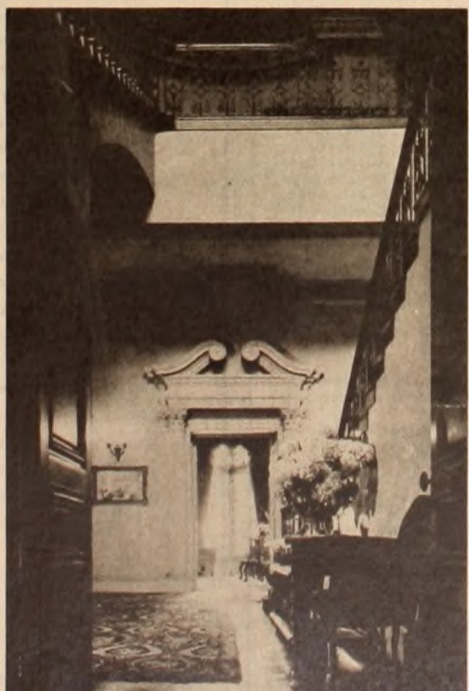
Insolentes pisos de lujo. Laberintos solitarios para uso de poquísimas personas.

Nos encontramos así con un monopolio establecido a favor de algunas decenas de miles de propietarios de casas urbanas, concentrados alrededor de algunos miles de grandes propietarios, que extraen a varios cientos de miles de familias de obreros y empleados un porcentaje de sus ingresos, equivalente al 30 ó 50 por ciento para los alquileres no congelados. Si, para los 6.000.000 de habitantes del gran Buenos Aires calculamos 1.500.000 familias, y si suponemos que sólo un 10 por ciento se aloja en departamentos con al-