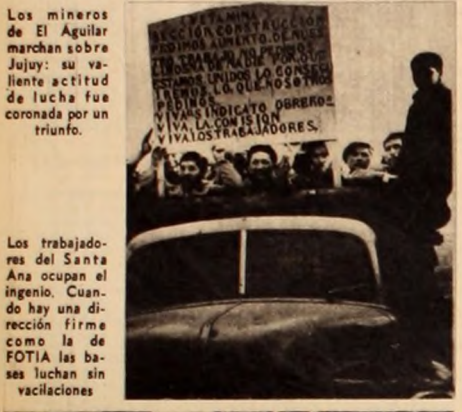
Los obreros de la mina de Santa Ana ocupan el ingenio. Cuando hay una dirección firme...