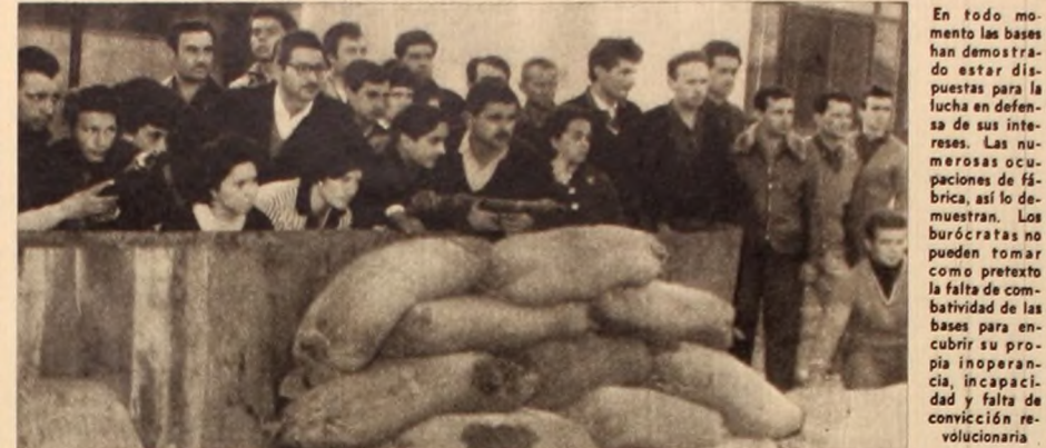
En C. E. E., los metalúrgicos de San Martín, en magnífico ejemplo de lucha, escribieron una página de oro del movimiento obrero...