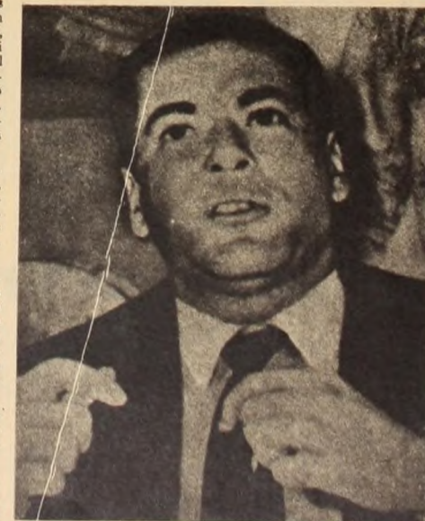
Lionel Brizola, ex gobernador de Río Grande del Sur y diputado nacional, nos dice "Me mantuve en la clandestinidad para estrechar contactos con mi pueblo"

—Estoy seguro de ello, el régimen profundizará sus características dictatoriales; el poder civil será destruido progresivamente. El Maris-