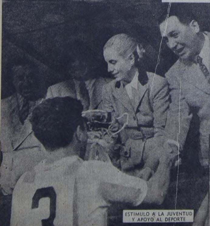
ESTIMULO A LA JUVENTUD Y APOYO AL DEPORTE