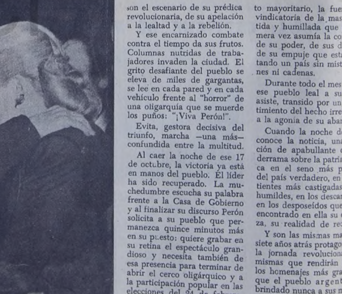
Los humildes, los postergados, los desposeídos: ellos fueron quienes le dieron a EVITA el carácter de símbolo vivo y bandera de la Revolución Peronista.