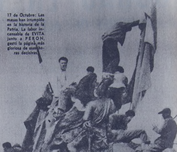
17 de Octubre: Las masas han irrumpido en la historia de la Patria. La labor incansable de EVITA junto a PERON, gestó la página más gloriosa de esta hora decisiva.