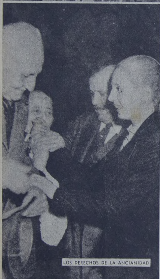
LOS DERECHOS DE LA ANCIANIDAD

Nunca como ahora sus palabras son más necesarias, más elocuentes. Frente a los intereses oligárquicos e imperialistas que nos hambrean, frente al régimen y su sistema que nos proscribe, frente a los burocratas que nos traicionan. Ante la dramática situación de los trabajadores, de los miles y miles de ancianos abandonados en la calle, de los niños desamparados y tristes. No sólo el pueblo, que recuerda, ha de brindar su mejor homenaje con las miras y las flores. El pueblo, así en mano, guiado por su ejemplo, ha de liberar a su Patria y de recuperar a su Líder. Nada debe detenernos en la acción pues, como dijo Eva Perón: "La victoria será nuestra, tendremos que alcanzárselo tarde o temprano, cueste lo que cueste o caiga quien caiga".