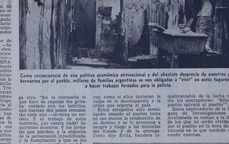
Como consecuencia de una política económica antinacional y del absoluto desprecio de nuestros gobernantes por el pueblo, millares de familias argentinas se ven obligadas a "vivir" en estos tugurios y a hacer trabajos forzados para la policía.

más peronistas que el propio Perón. Pienso que este tipo de gente no ha comprendido nunca a nosotros, las bases populares. Todavía se empeñan en todavía creen que estamos utilizando nuestra doctrina y nuestro líder, que son esencialmente revolucionarios. Condenan el Movimiento que lucha por terminar para siempre con la injusticia impuesta por una poca de un partido al estilo de los demócratas y los radicales, que se burlan para burlar al pueblo, ¿es que quieren ser cómplices de esta burda? A los señores que se burlan de la fuerza que tenemos tomado el tiempo. Que se cuiden de andar haciendo partidismo fuera del Movimiento Revolucionario que manda Perón, porque las bases lo respaldarán y pasarán por encima de ellos. En cambio, los activistas de la izquierda no cuentan con todo nuestro apoyo, porque lo que hacen es responder a la voluntad de las bases. Nosotros tenemos una sola consigna: organizarse para la lucha con Perón al frente.