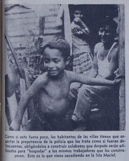
Como si esto fuera poco, los habitantes de las villas tienen que soportar la prepotencia de la policía que los trata como si fueran delincuentes, obligándolos a construir calabozos que después serán utilizados para "hospedar" a los mismos trabajadores que los construyeron. Esto es lo que viene sucediendo en la Isla Maciel.