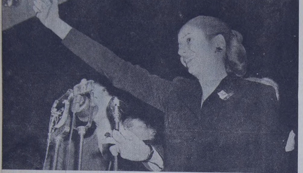
La mano en alto, la sonrisa en los labios, la palabra ardiente para fugitar a los enemigos del pueblo. Así la vieron tantas veces los descamisados y así la tienen presente.