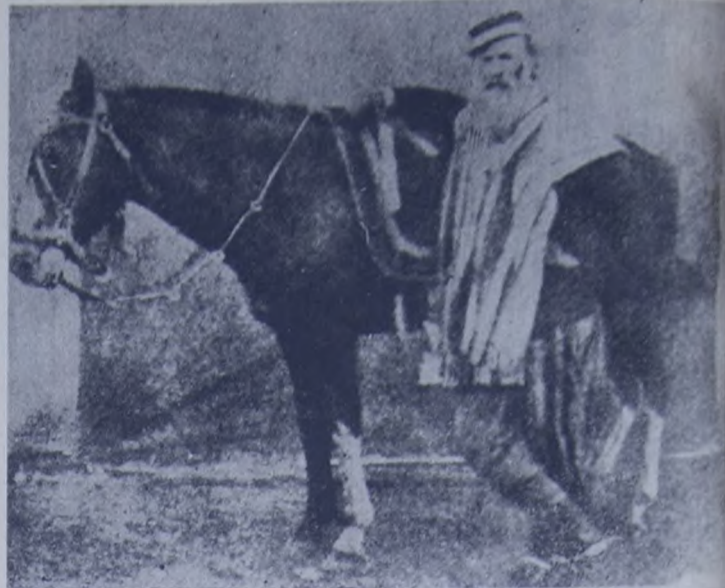
Así conocía el pueblo de Entre Ríos a Ricardo López Jordán, auténtico caudillo popular, incansable luchador contra el liberalismo mitrista: a caballo, al frente de sus gauchos con los que escribió páginas de gloria en la historia de nuestras luchas populares.

Al finalizar 1864 un tremendo episodio conmueve y sacude a todo Entre Ríos: el sitio y la heroica defensa de Paisandú, plaza abierta, que resiste a los esfuerzos bélicos coaligados de los colorados, los brasileños y los mitristas al mando de Venancio Flores. Esta impresionante página de coraje —que culminará con la sangrienta matanza de los defensores de la ciudad— tampoco saca a Urquiza de su mutismo interesado, como no sucedería frente a otro tremendo episodio de la degradación imperialista oligárquica: la guerra del Paraguay. El aplastamiento del valiente y patriota pueblo paraguayo —verdadero crimen colectivo consumado por los círculos pro imperialistas— contó con la repulsa abierta de todos los pueblos del interior que veían como suya, precisamente, la causa paraguaya y no la del mitrismo.