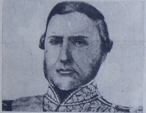
Justo José de Urquiza: abandonó el campo de batalla en Pavón, cuando la victoria era de su caballería. A partir de allí el defensor del auténtico federalismo en Entre Ríos fue López Jordán.

Al exilio en el sur del Brasil va López Jordán, pero por poco tiempo. El 1º de mayo de 1873 invade de nuevo la provincia y nuevamente va a guerrear con coraje al frente de su pueblo hasta la derrota definitiva en Alcañaco, que lo envía definitivamente a Montevideo para una década de amargo exilio. La muerte lo esperaba en el nido mismo de la burguesía entreguista, contra cuyos intereses, contra cuyas arbitrariedades y explotación luchó siempre. No pudo morir a campo abierto, imitando en la libertad de esos campos entrerrianos que tan entrañablemente amaba. Su pueblo, sus paisanos no lo olvidaron y no lo olvidan, porque la memoria de los pueblos nunca es ingrata. López Jordán fue el último montonero federal. Pero desde luego no el último representante de ese pueblo nuestro, oscuro y tenaz, que un día de 1945 decidió ser de nuevo protagonista de su propia historia.