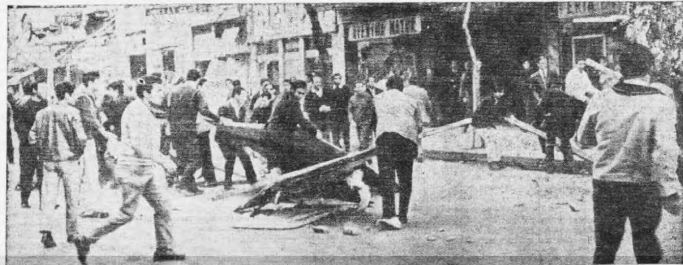
La barricada, un elemento espontáneo de lucha

Pero los compañeros más combativos en el orden local, no cesaron en su lucha y en la denuncia permanente de las maniobras