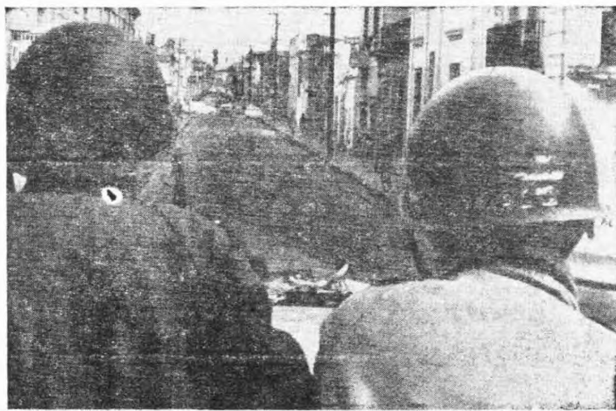
Las calles desiertas delatan la presencia del ejército de ocupación

Es estallido insurreccional de mayo, que tuvo su expresión más alta en los sucesos de Córdoba, no es un hecho aislado ni ocasional, sino que es producto de un largo proceso que arranca en la contrarrevolución de 1955, y cuyo desarrollo aún no se ha completado. Es preciso entonces analizarlo teniendo en cuenta todos los factores que influyeron para desencadenarlo. Recordemos además la necesidad de superar la tendencia a abrir juicios subjetivos que se basan en apreciaciones superficiales de los hechos y no en una valoración de los mismos.