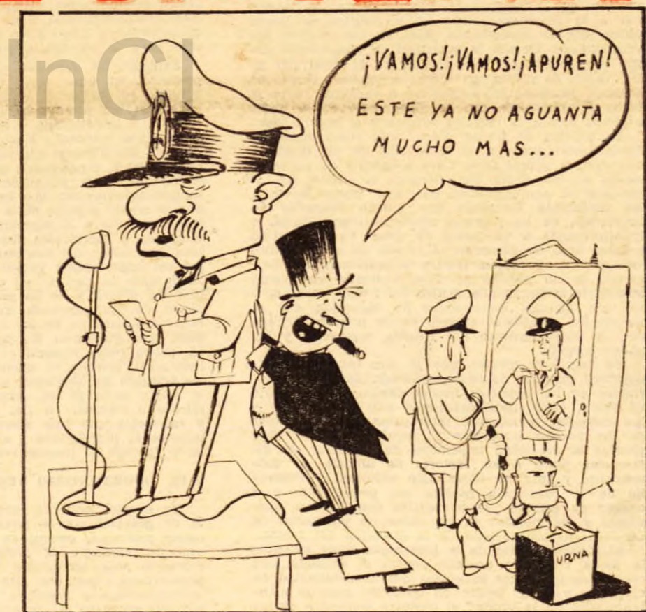
Unganía está acabado. La gran burguesía monopolista lo mantiene mientras busca el recambio entre el golpe "nacionalista" o la salida liberal.

Plenario nacional contra Coria, la patronal y el sistema. — Página 6