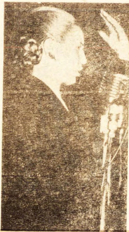
Eva Perón, expresión de la conciencia del proletariado en ascenso.

La traición de la izquierda pequeño-burguesa privó a la clase obrera de su expresión orgánica, el partido proletario, frente al gobierno revolucionario burgués. Evita llenó esa falencia con su acción personal, aunque careciendo de la lucidez que suministra el conocimiento teórico y de la