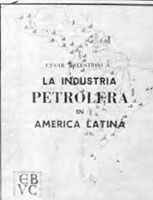
CESAR BALESTRINI C. LA INDUSTRIA PETROLERA EN AMERICA LATINA

PRIMERA PARTE La Industria Petrolera en el panorama económico de América Latina. Importancia económica y fiscal del petróleo en la economía latinoamericana.