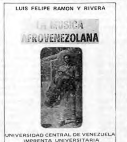
LUIS FELIPE RAMON Y RIVERA LA MUSICA AFROVENEZOLANA

El estudio de la música etnográfica, y folklórica y en este caso específicamente de la afrovenezolana, se justifica desde dos puntos de vista; el histórico-social y el artístico. No basta oir , o oír que tenemos una música de características africanas: es necesario apreciarla y estudiarla. De la misma manera, nada sería el dato histórico sobre la esclavitud y la trata de negros durante el período colonial, si no quedara ninguna inquietud o indiferencia de naturaleza sociológica—como resultado de tal conocimiento. En sentido general, y ajena a estos estudios, la música afrovenezolana existe, está ahí complementando un proceso histórico, efectuando una forma de mestizaje, sirviendo a determinadas expresiones populares. Si se la estima y aprovecha como es debido, es cosa que corresponde a investigadores y artistas. Su esencia es hoy día venezolana, y puede servir, si hay alguien capaz de hacerlo, de punto de apoyo a un arte de caracteres nacionales que nos permita figurar con relieve propio en el concierto de la cultura universal.