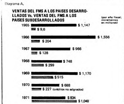
Diagrama A. Ventas del FMS a los Países Desarrollados vs. Ventas del FMS a los Países Subdesarrollados (en millones)