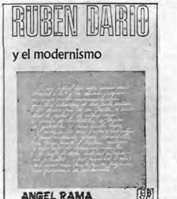
ANGEL RAMA RUBEN DARIO y el modernismo

Sumario: Introducción — Elementos culturales — Las fiestas. Los bailes — La melodía — El ritmo — Los instrumentos — Elementos dispersos — La poesía — Transcripciones musicales.