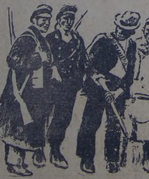
Esta declaración de principios de la Organización Nacional de Obreros de esta industria, ha sido completamente olvidada por los que proponen un proyecto de estatutos que carece de un sentido proletario de clase y pretende asegurar la legalidad rehusando a los postulados fundamentales que dieron nacimiento al movimiento obrero internacional, sindicalista y organizado.