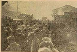
Azaña huyó a París alojándose en la misma embajada española. Estos refugiados, después de cruzar a pie los Pirineos, hacen fila en el puesto fronterizo, esperando ser admitidos en Francia... para ingresar en campos de concentración, donde aún están, muchos de ellos, expuestos a ser entregados a Franco.

novas del Castillo, su maestro en ideas políticas, que siendo presidente del Consejo de ministros y estando España en lucha abierta contra la insurrección cubana, dió acceso a las figuras más destacadas del autonomismo y del separatismo cubano, para que se expresaran con toda libertad desde la tribuna del Ateneo.