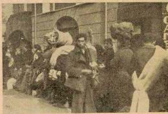
Así como tuvo habilidad para eludir la cárcel durante la monarquía, Azaña se cuidó muy bien de compartir la suerte de su pueblo en los momentos de mayor peligro. Fué siempre el primero en huir. Tampoco conoció el trato que estos guardias senegaleses dieron a los refugiados.

Estamos al final del Gobierno Berenguer. Los sucesos de Jaca y el fusilamiento de los héroicos capitanes Fermín Galán y García Hernández, pusieron de manifiesto los estragos que la Revolución venía causando a la Monarquía. El viejo régimen se tambaleaba. Los elementos destacados del republicanismo se refugiaron en el Ateneo de Madrid. Comienzan las conferencias y las discusiones tumultuosas que dan calor al sentimiento revolucionario popular. Berenguer y Mola intervienen amenazando con clausurar la docta casa. El ministro de la Gobernación llama repetidas veces al doctor Marañón a su despacho, amenazándole con meter