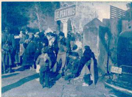
Las autoridades francesas separaron en la frontera a todas las familias, agrupando las mujeres en un sitio, y los hombres y niños en otro. Los campos de concentración es lo que esperaba a tantas víctimas de la invasión fascista, después de los terribles sufrimientos en España, y del cruce de los Pirineos.