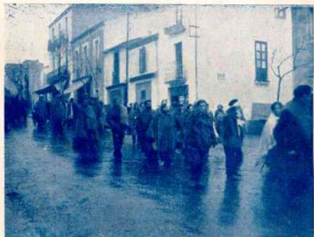
El ejército español, en retirada, deja tras sí la propia tierra invadida y esclavizada.