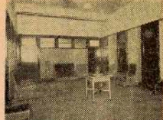
Una desmenuadora del local sadist.

Pero no basta todo ello a sus ansias de mejoramiento; hay que hacer más, y se acuerda unánimemente, en una asamblea magna de trabajadores de todos los ramos convocada por la Federación Local de Sindicatos de Industrias, dejar un día por ciento de jornal para ayudar a las Colectividades que lo necesitan y remediar el paro forzoso. Y es precisamente en este segundo sentido que mediante la aportación de dicho 6 o/o se realizan atrevidos proyectos. Construyen y dan vida a una industria nueva en la localidad: "La Industrial Harinera, Industria Socializada". Esta industria, que ha ocupado brazos que no sabían dónde emplear sus esfuerzos dará (la está dando ya) potenciali-