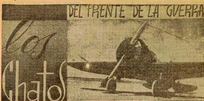
Las luchas por el predominio en el aire