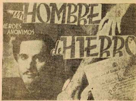
De "UMBRALES" de Barcelona, 8 de enero de 1938

Los oíamos avanzar lentamente, con pesadez de elefante. La gente se había distribuido rápidamente en sus puestos para la resistencia; pero yo comprendía que había que hacer algo más, y me dispuse a todo. Recibí una orden y sin vacilar, el fuési antitankero terciado a la espalda y el cinturón de bombas pres-to me lancé a la calle. El portón se abrió para darme paso y se cerró