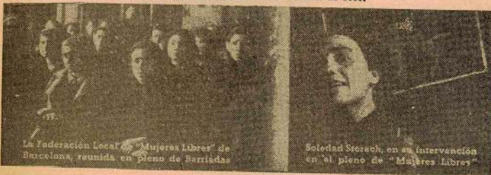
La Federación Local de "Mujeres Libres" de Barcelona, reunida en pleno de herriadas

Libres — que ya en agosto del 36 comenzó a organizar sus Brigadas de Trabajo —, en relación al problema de la substitución de los hombres movilizados y movilizables. 17 de Abril de 1938.