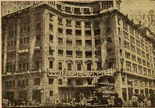
Edificio que ocupa desde el 19 de Julio de 1936, en Barcelona, la C. N. T.

Creado que fué el Comité Técnico Administrativo