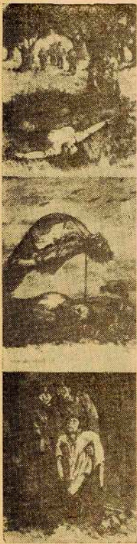
La peor de las infamias. - En el fondo del mar. - Para que levante el puño.

En los Planes de Rápida 'Liquidación' de la Guerra Española, no se Contó con la Heroica Resistencia de ese Pueblo