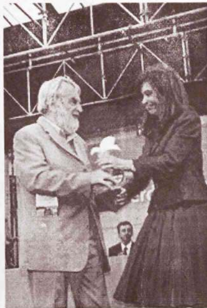
Año 2008: Osvaldo Bayer compartiendo escenario con Cristina Kirchner.