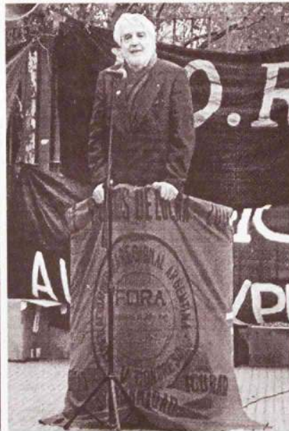
Año 2011: Osvaldo Bayer en el acto de "F.O.R.A." Capital.

La primer foto, conocida públicamente, es solo la evidencia de lo que el compañero Amanecer Fiorito viniera advirtiéndolo por años, personalmente y desde las páginas de La Protesta: la vinculación de Bayer con el Poder. Hecho que, a muchos que han ocupado lugares del anarquismo, ha convenido acallar por revelar sus propios posicionamientos.