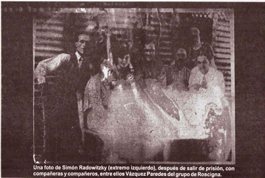
Una foto de Simón Radowitzky (extremo izquierdo), después de salir de prisión, con compañeras y compañeros, entre ellos Vázquez Paredes del grupo de Roscigna.

Después pasa a decir esto, que de no estar escrito sería imposible de imaginar: