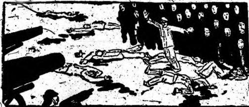
Dibujo de Hoffmeister

Los intentos contrarrevolucionarios, que aquí tampoco faltan, son reprimidos con guño de hierro por el poder soviético, con el apoyo de amplias capas de la población.