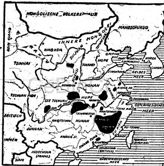
Circuitos ocupados por los Soviet-Chinos establecidos

Los grandes éxitos cosechados por el ejército rojo de la China Soviética en su heroica lucha contra Tchang-Kai-Schak y sus aliados imperialistas demuestra en que medida dispone de un