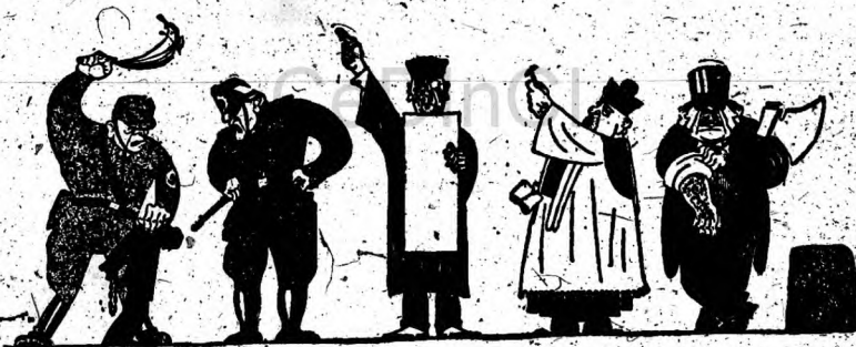
Dibujo de W. A.

Traduciendo esto al lenguaje común y a la realidad del social-fascismo, vemos que la caja de Pandora de la socialdemocracia se abre de continuo para los males más graves del proletariado internacional. Como caja es imatogable. Y entre sus males, la insidia más refinada figura con relieve propio. El periodismo partidario se encarga de expandirlos cuidadosamente.