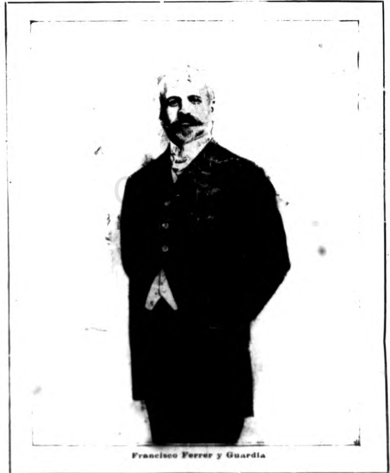
Francisco Ferrer y Guardia